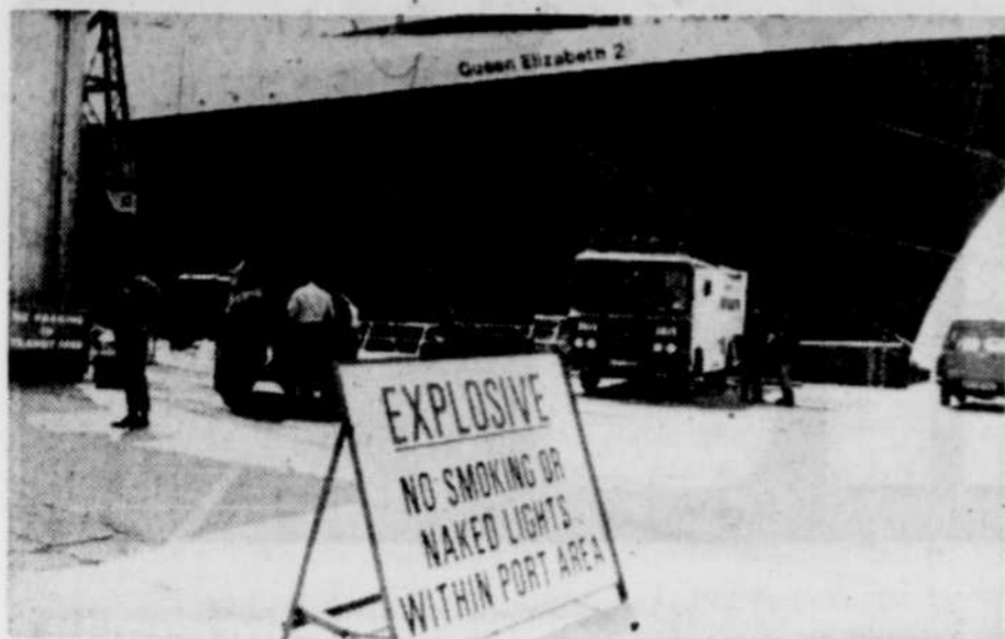
Sur le quai où est amarré le célèbre paquebot, une pancarte signalant la présence d'explosifs permet de déceler une situation particulière: Le QE-II s'en va-t-en guerre.