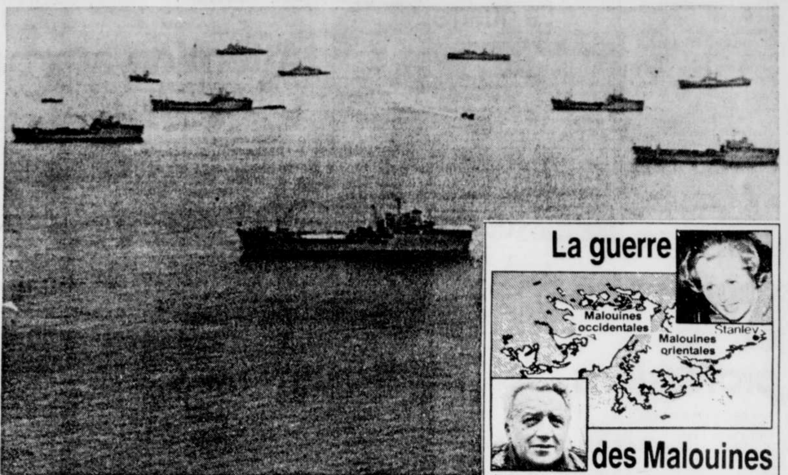
Les habitants de l'île de l'Ascension, au milieu de l'Atlantique, l'ordre donné, iront rejoindre la quarantaine de navires de guerre déjà arrivés aux îles Malouines. peuvent apercevoir depuis quelques jours un certain nombre de navires de la force d'intervention britannique qui, une fois

Le fait est que plusieurs membres de l'entourage de M. Haig paraissent avoir été décontenancés par l'attitude des militaires argentins lors des entretiens qu'avaient eus le secrétaire d'Etat américain à Buenos Aires avant le déclenchement des hostilités. "Nous ne paraissions pas parler le même langage", a déclaré en privé un haut fonctionnaire ayant accompagné M. Haig dans les deux voyages qu'il avait effectués en Argentine, au cours de sa mission de bons offices.