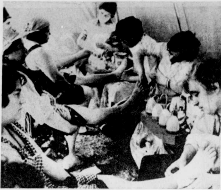
Des milliers de pèlerins affluent vers Fatima à l'occasion de la visite du Saint-Père demain. Plusieurs d'entre eux viennent de régions éloignées et doivent, en conséquence, se faire soigner après une marche de huit jours. Des tentes ont été aménagées à cet effet.

Lucia garde, dans sa vie claustrale, un esprit jeune et serein et une joie intérieure de tous les moments, selon sa soeur aînée: "Elle est toujours contente. Je ne l'ai jamais vue triste".