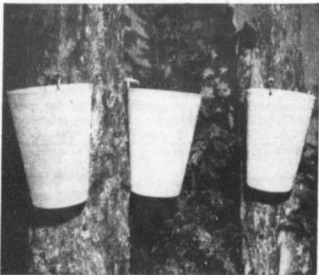
Accrochés à l'arbre, les nouveaux seaux à recueillir l'eau d'érable fabriqués par Les Industries Provinciales permettent au cultivateur de voir même à distance le niveau atteint par la sève. Le plastique rigide conserve sa forme, même à pleine charge.