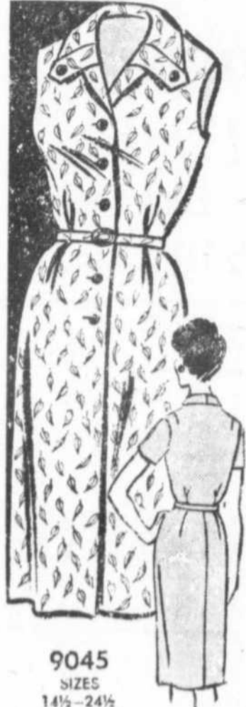
9045 SIZES 14½-24½

Si les enfants se sont ainsi développés, il faut semble-t-il en attribuer pour une large part au manque de surveillance, aussi à une activité trop encombrante des parents, qui sous prétexte de nombreuses occupations ne prennent pas le temps voulu, pour s'occuper de connaître leur enfant, tôt le matin on le pousse à la rue, il entre quinze, vingt minutes pour manger et toujours l'espère pour partager jusqu'à