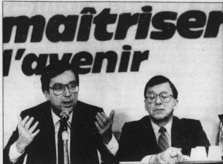
M. Robert Bourassa et le leader du PLQ à l'Assemblée nationale, M. Gérard-D. Lévesque.

Lacs, servant au passage de régulateur du niveau des cours d'eau pour éviter les inondations, l'eau douce serait transférée vers l'Ouest du Canada par le truchement de réservoirs, d'aqueducs, de stations de pompage, de centrales et de canaux de drainage (au coût de $50 millions) et vers les États-Unis par le réseau naturel des lacs et rivières.