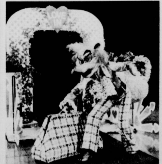
Ce love-in avec monsieur le Loup peut sembler être une nouvelle version du petit chaperon rouge.