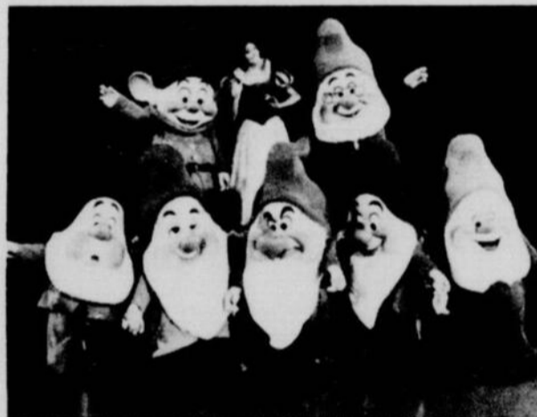
Blanche Neige, au milieu des sept nains, ce n'est qu'une des 12 productions nouvelles que les enfants pourront voir au Forum du 28 septembre au 3 octobre.

Billets en vente maintenant aussi Mtl. Trust (PVM) — Pour groupes, tel: Jean Foisy, 832-8131