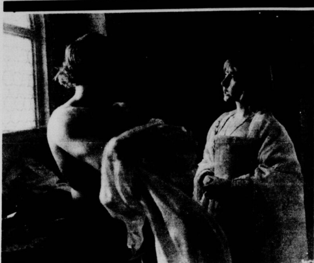
Warner Brothers n'échappe pas à la vague des films de sexe et au cinéma de la Place Ville Marie, on trouve "The Devils", un long métrage qui met en vedette Vanessa Redgrave et Oliver Reed.