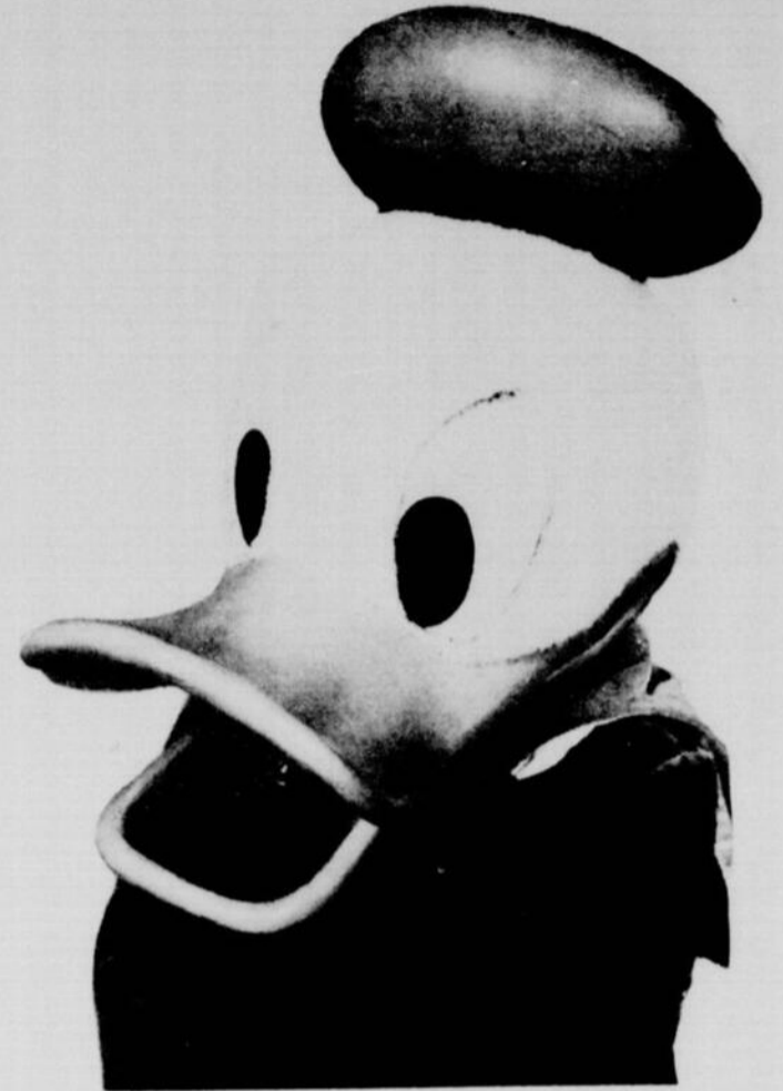
Imagine en 1934 par Walt Disney, Donald le Canard, s'est avéré depuis un des personnages le plus populaires de la galerie de la parade populaire de ce show.

Donald le Canard se vit confier la vedette de nombreux autres courts métrages et en 1943, il atteignait le rang de "superstar" avec le long métrage animé "Saludos Amigos". Puis ce fut en 1945, "Les Trois Caballeros", le premier film où Disney combina les dessins animés aux scènes avec interprètes vivants. Donald et ses deux compères, Carioca