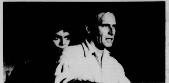
Charlton Heston joue le rôle principal dans "The Omega Man", un film à sa mesure qui met aussi en vedette Rosalind Cash. Il s'agit d'un drame où les scènes fantasmagoriques se retrouvent à profusion. A voir au Palace.