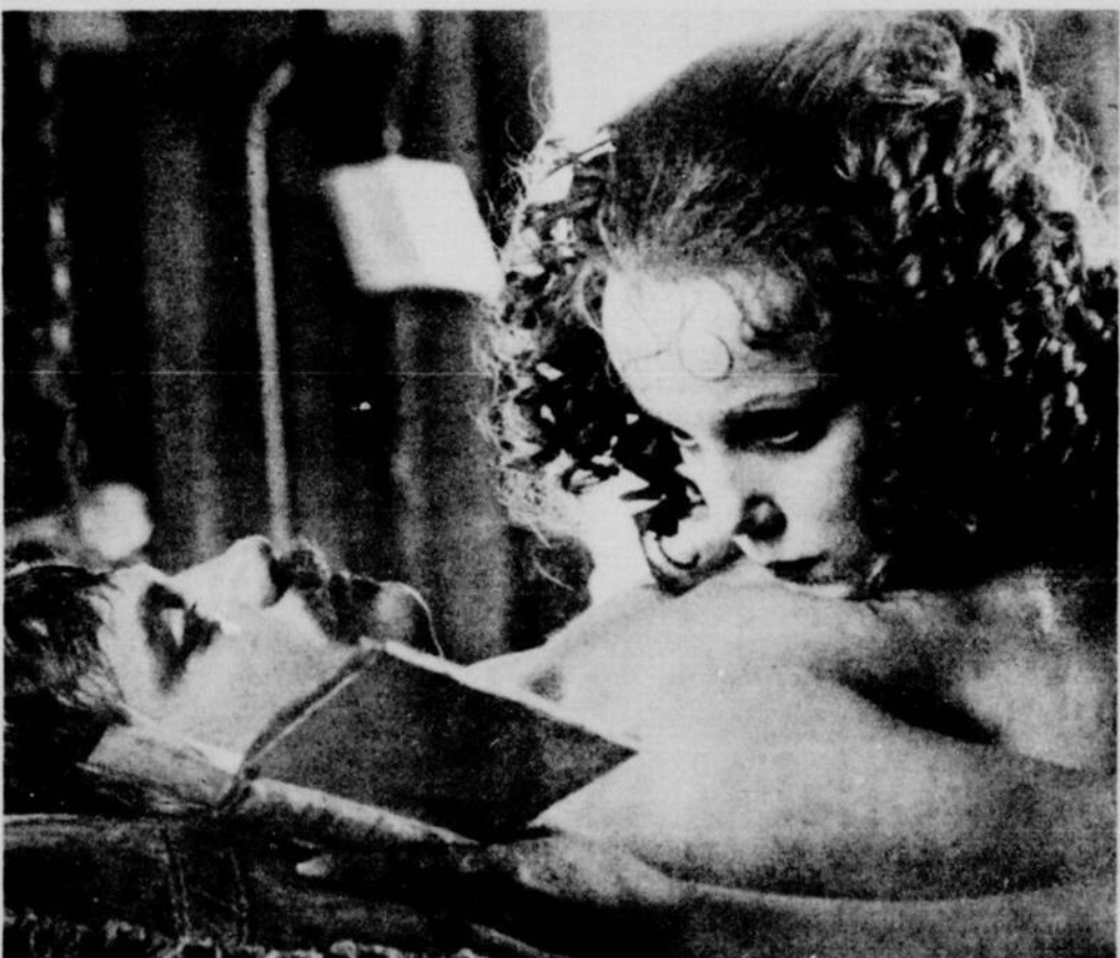
Oliver Reed, un vrai guerrier au repos avec Georgina Hale qui adore lire en faisant l'amour. Dans ce film, Reed est un prêtre non conformiste et Mlle Hale la maman d'un enfant sans père.