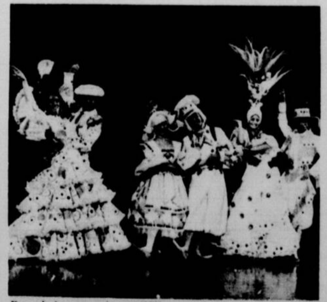
Parmi les numéros différents du monde de Walt Disney, plus de 21 pays sont représentés, chacun dans leur costume propre.