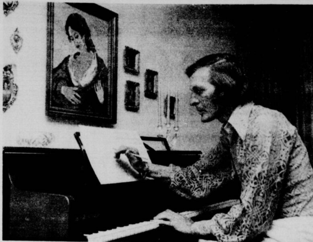
Voici l'orgue que s'est fait chiper Montreuil: une perte sèche de $2.000, à moins que les assurances ne lui en remboursent une partie, ce qui n'est pas certain.

Montreuil espère que ses assurances sont à jour. Sinon, ce sera une perte sèche.