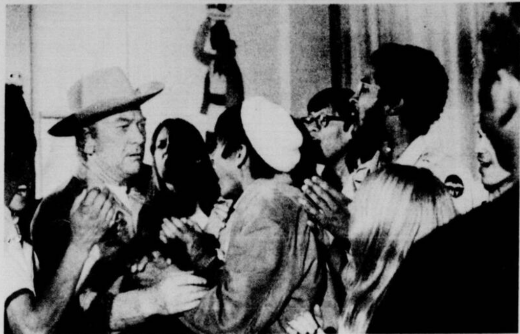
Ken Tobey dans le rôle du sheriff Mike tente en vain de contrôler les étudiants d'une Ecole de la Liberté, dans une scène du film "Billy Jack" qui met aussi en vedette Tom Laughlin et Dolores Taylor, au York.