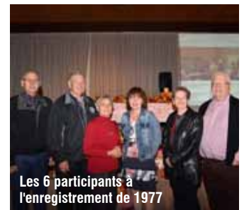
Les 6 participants à l'enregistrement de 1977