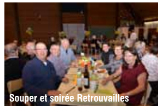
Souper et soirée Retrouvailles

Le comité du 150 e souhaite une bonne et heureuse année 2018 à chacun et chacune de vous et vous dit merci pour votre présence lors de ses nombreuses activités.