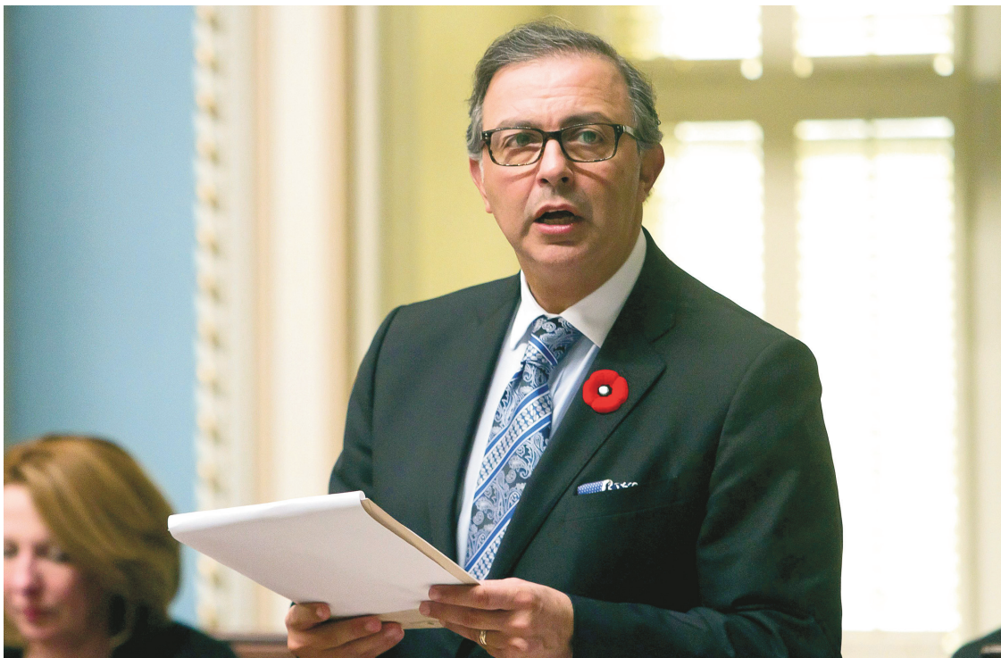
Le ministre du Travail, de l'Emploi et de la Solidarité sociale, Sam Hamad, a déposé mardi le projet de loi 70 à l'Assemblée nationale, à Québec.

Jusqu'à maintenant, les programmes incitatifs n'ont pas donné les résultats souhaités