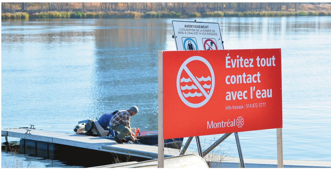
La Ville a affiché des mises en garde le long du fleuve, mardi.

Les inquiétudes sont vives au comité ZIP (« zone d'intervention prio-