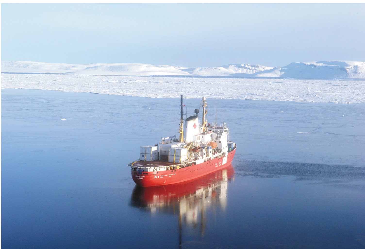
Le brise-glace de recherche canadien Amundsen dans un paysage arctique