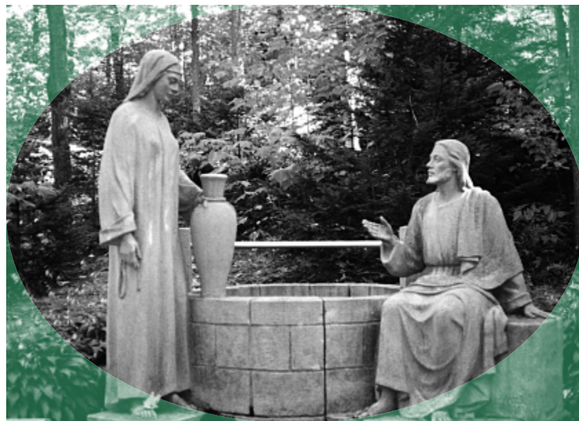
La Samaritaine, sculpture à Beauvoir.

brations liturgiques en Église, est appelée à s'inscrire dans la vie de tous les jours, même dans ce qu'elle comporte de plus ordinaire. En d'autres mots, nous pouvons et même nous devons devenir de plus en plus des adorateurs et adoratrices du Père en esprit et en vérité dans toutes nos actions, dans toutes nos entreprises, et même dans tout ce qui, au cœur de nos vies et de nos relations avec les autres, appelle au dépassement. C'est cela que Paul laisse entendre aux chrétiens de Rome lorsqu'il leur dit : « Je vous exhorte, mes frères, par la tendresse de Dieu, à lui offrir votre personne et votre vie en sacrifice saint, capable de plaire à Dieu : c'est là pour vous l'adoration véritable » (Rm 12, 1).