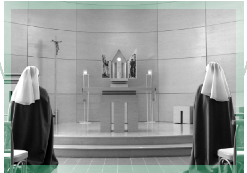
Chapelle du Monastère des Recluses Missionnaires, Montréal.

Dimension intérieure de la solitude, le silence rend possible le retour aux profondeurs du cœur et aux sources de la prière. Il est expression d'amour envers nos sœurs et de respect pour le mystère de chacune.