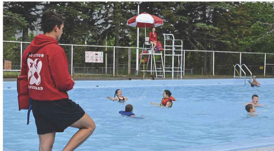
La piscine municipale du parc Laurence, à Coaticook, sera bientôt rénovée, mais sans l'aide financière du gouvernement du Québec.

Comme Coaticook agira seule, les sommes dépensées auront certainement un impact sur le compte de taxes des citoyens. On évalue le projet à quelque 5,7 millions de dollars. Toutefois, celui-ci, qui est inscrit au Programme triennal d'immobilisation, comprend la construction d'un nouveau bâtiment de services. Cette option sera laissée de côté, ce qui diminuera la facture. « On donnera simplement un peu d'amour