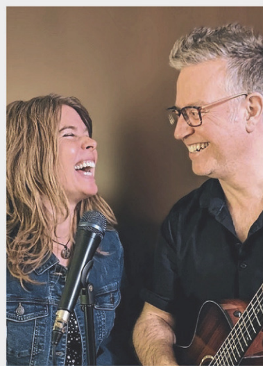
20 JUILLET 2024 - Duo Tang