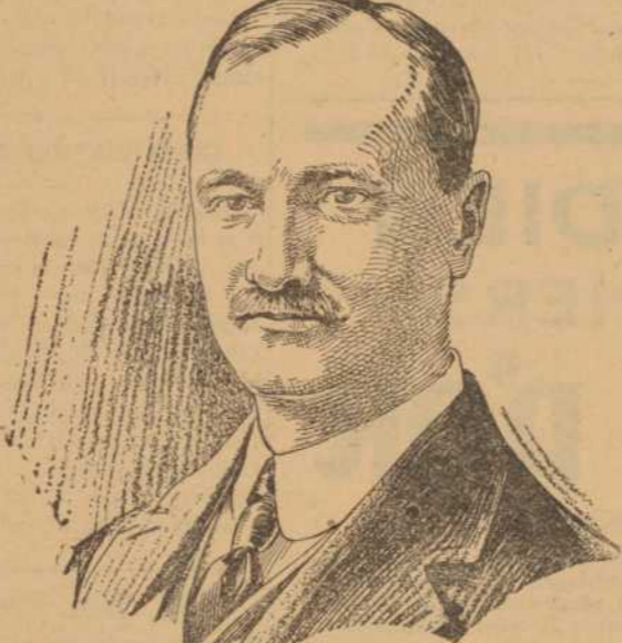
Un vote pour l'honorable M. Patenaude et les candidats qui pensent comme lui, c'est un vote pour vous-même et pour le pays.

Le Comité central conservateur. 120, rue S.-Jacques, Montréal.