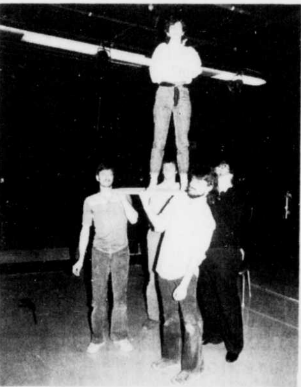
Au cours d'une répétition d'Antigun