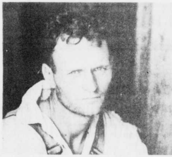
Photographie de Sherrie Levine

Agissez avant qu'il ne soit trop tard, Antigun, un spectacle POUR la détente si la vie vous intéresse!