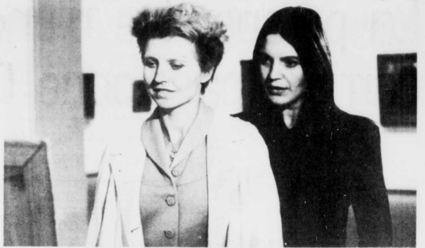
Hanna Schygulla et Angela Winkler, incarnant Olga et Ruth dans "L'amie".

Car, tout au long de la première moitié et jusqu'à ce que se réve-