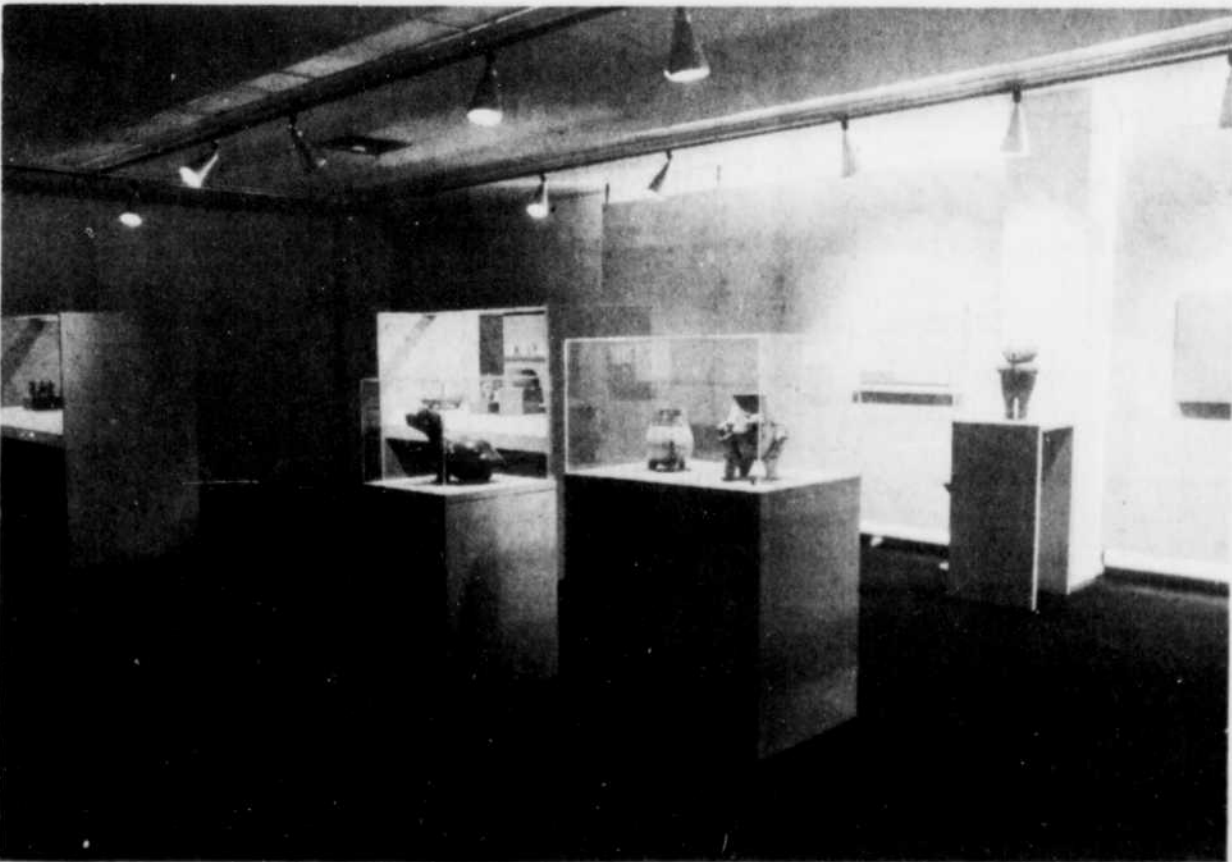
Céramiques anciennes du Nouveau Monde

Cette exposition nous présente la version cubaine d'affiches de cinéma.