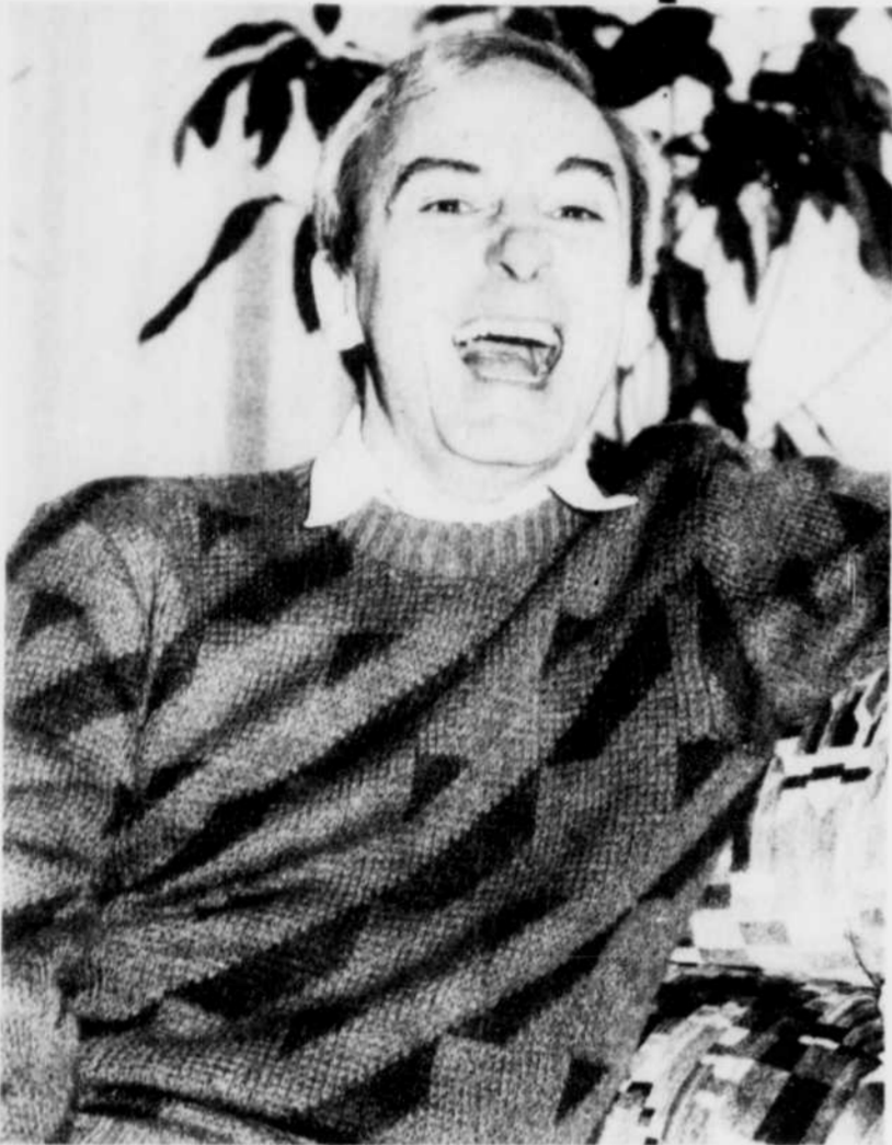
Yvon Deschamps: aller ailleurs, ce n'est pas aller plus loin.