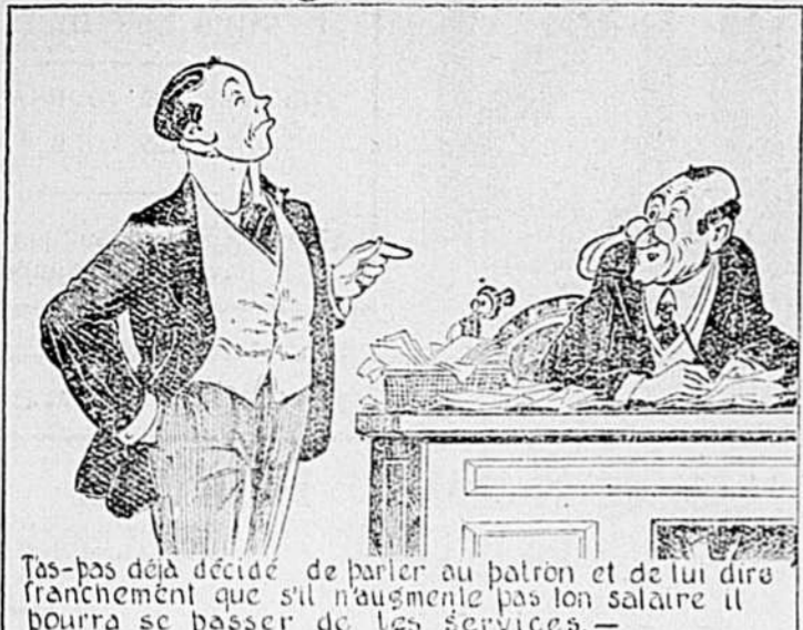
Tas pas déjà décidé de parler au patron et de lui dire franchement que s'il n'augmente pas ton salaire il pourra se passer de tes services.