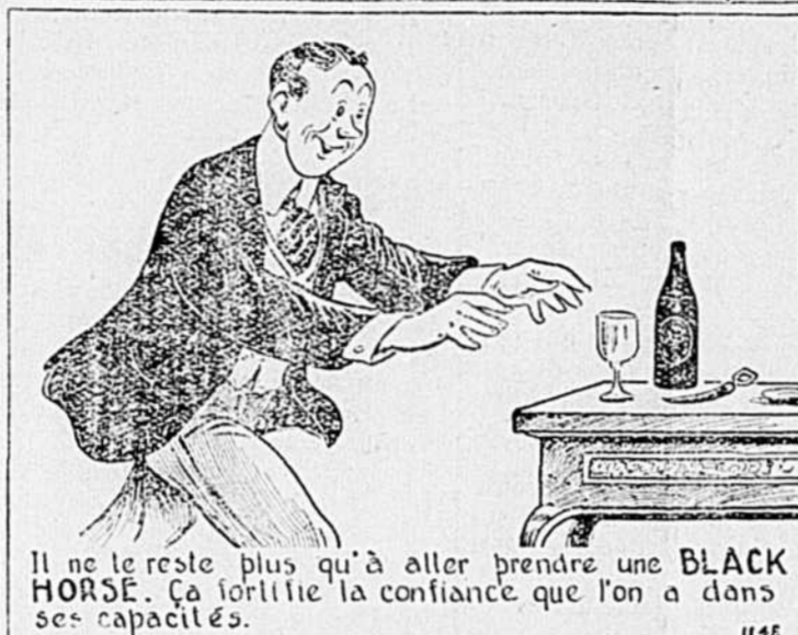
Il ne te reste plus qu'à aller prendre une BLACK HORSE. Ça fortifie la confiance que l'on a dans ses capacités.

dites simplement - "Bière Black Horse Dawes s.v.p."!