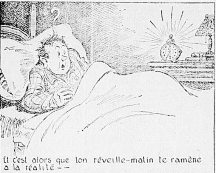
Et c'est alors que ton réveille-matin te ramène à la réalité.