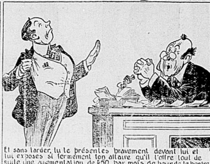
Et sans tarder, tu le présentes bravement devant lui et lui exposes si fermement ton affaire qu'il l'offre tout de suite une augmentation de $50. par mois, de peur de le perdre.