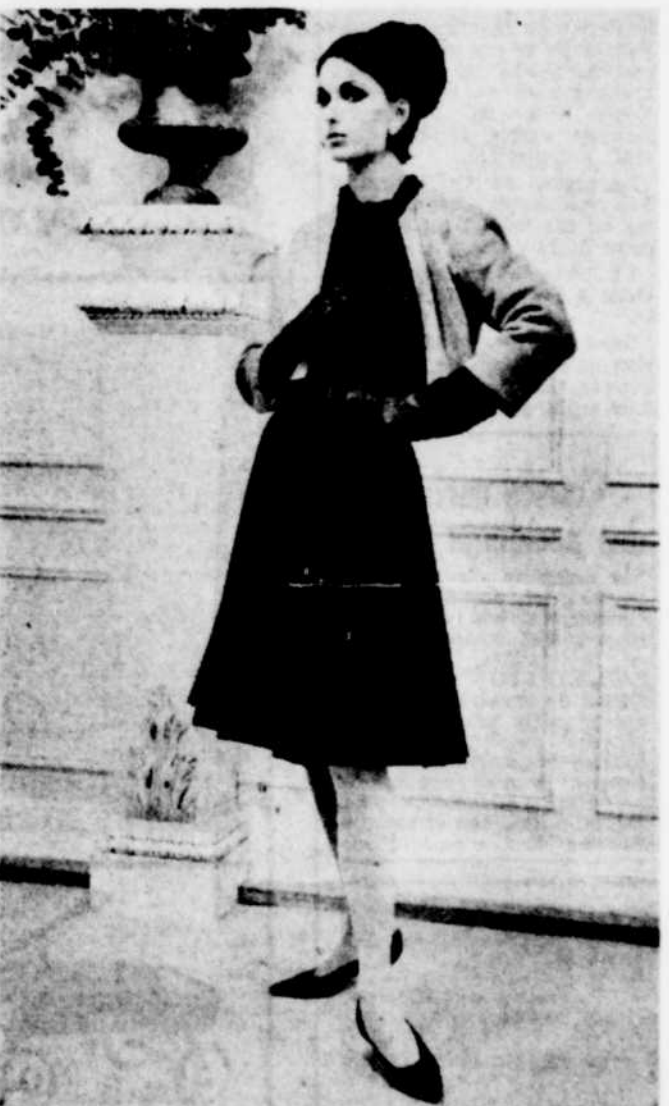
NEW YORK — Pour plusieurs l'automne et l'hiver sont les saisons de l'élégance. Voici un ensemble qui témoigne de cet avant!

La couleur fait souvent toute la différence. Alors changez votre passif en actif par la magie des couleurs!