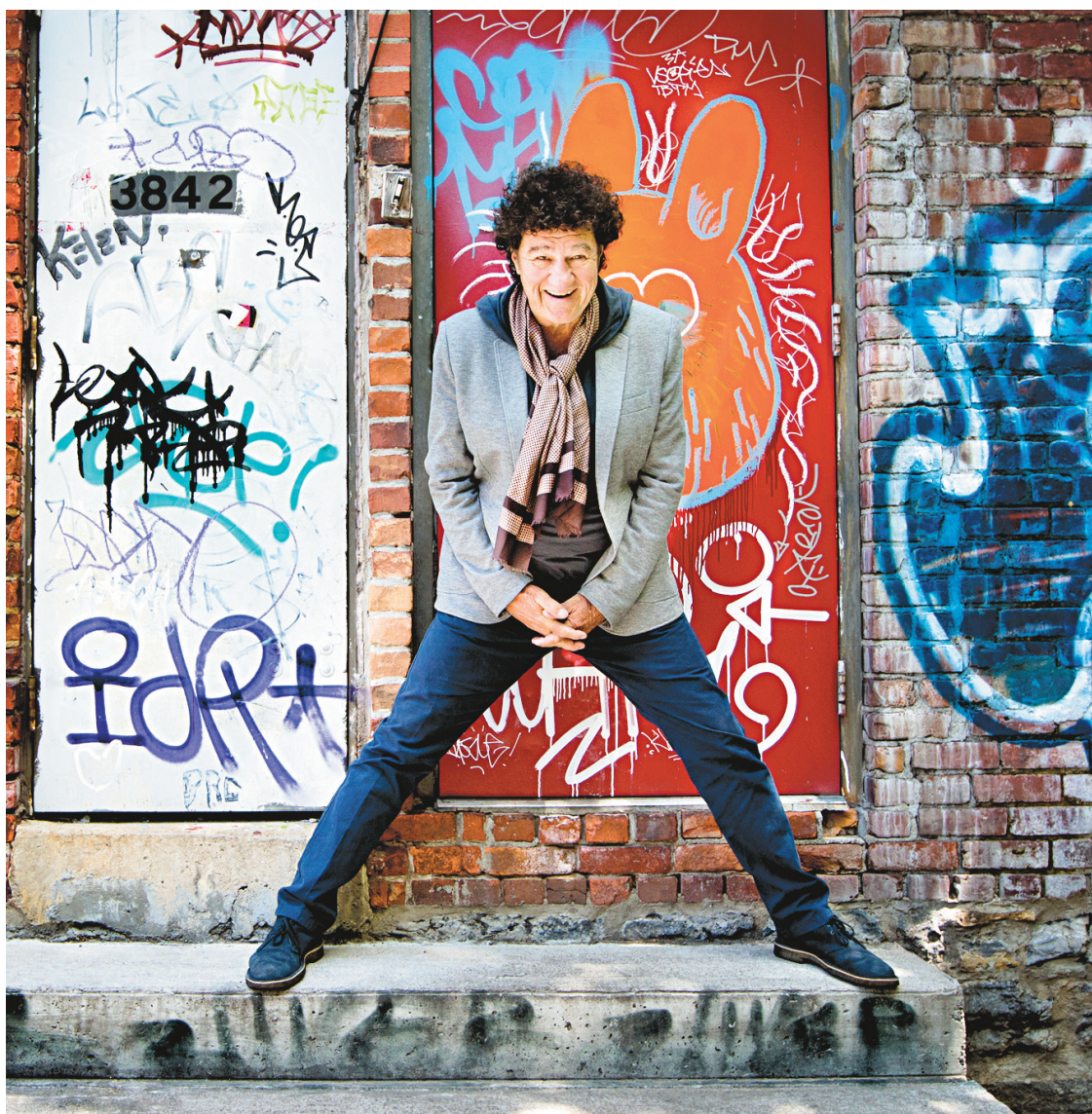
C'est en 1967, par l'écriture de la chanson Demain l'hiver , que Charlebois a trouvé l'artiste qu'il est.

En entrevue, Charlebois est à la fois incontrôlable et intarissable. Interrogé sur ses débuts, il reconnaît avoir trouvé sa voix avec la chanson Demain l'hiver , écrite en 1967. « C'est juste sur le troisième disque, quand j'ai réalisé que je ne serais jamais Ferré, ni Nowgato, ni Gainsbourg — j'étais moi —, que j'ai commencé à parler de la sloche, des joueurs de hockey et du Canadien! Peut-être que la chanson la plus importante de ma vie, ça a été