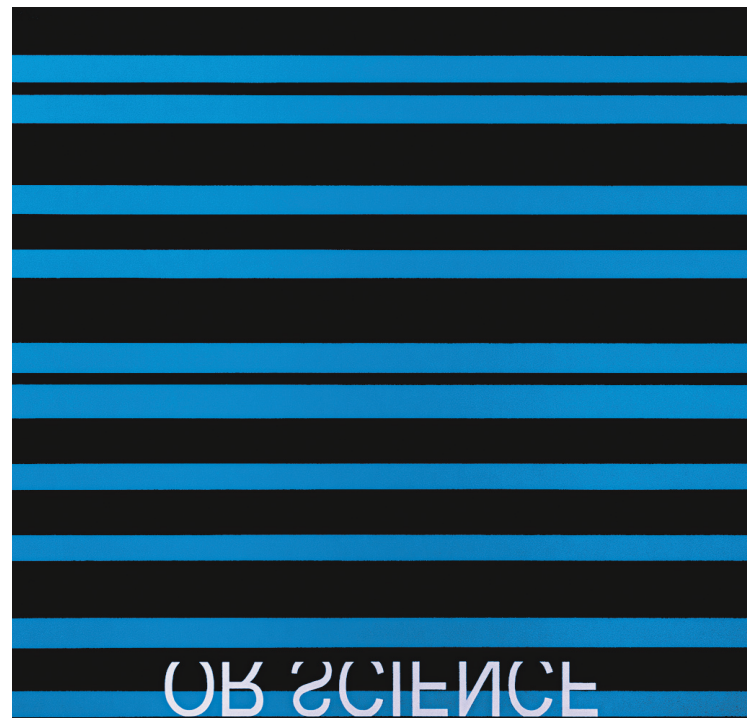
Véronique Savard, Miracle or Science , 2013.