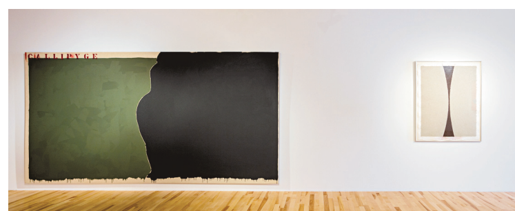
Vue de Chacun montre à chacun à la galerie Trois Points.

Trois Points propose, avec l'expo Chacun montre à chacun , de révéler les sources d'inspiration des artistes. Cinq d'entre eux, quatre peintres et un photographe, se sont prêtés au jeu. Si l'exercice respire le fonds de commerce, voire le marché secondaire, il fait plaisir à voir. Les rapprochements stylistiques auront toujours de quoi étonner.