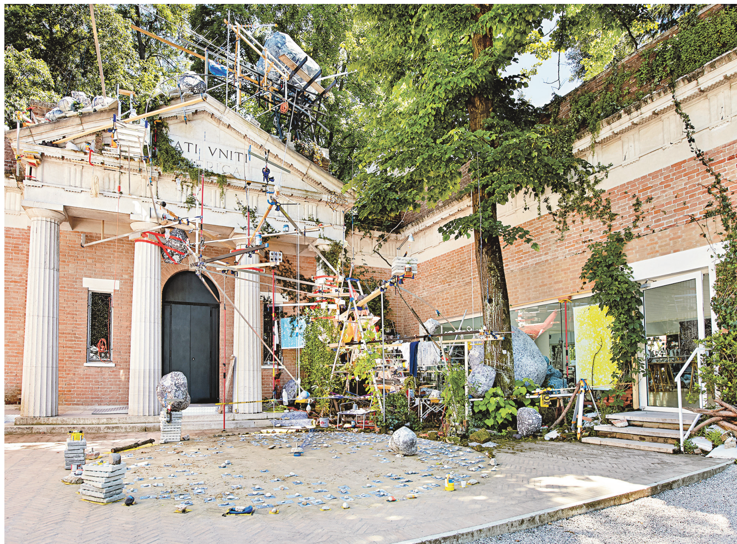
Sarah Sze, Triple Point (Gleaner) , 2013. L'œuvre maîtresse du pavillon des États-Unis évoque la fragilité de notre monde, un univers de calculs et de mesures dont la compulsion laborieuse côtoie un équilibre incertain, annonciateur d'une chute.

La participation de la France n'a pas non plus d'enjeu politique dans sa mire, mais elle se révèle d'une perfection aboutie et d'un pur ravissement. Autour du Concerto en ré pour