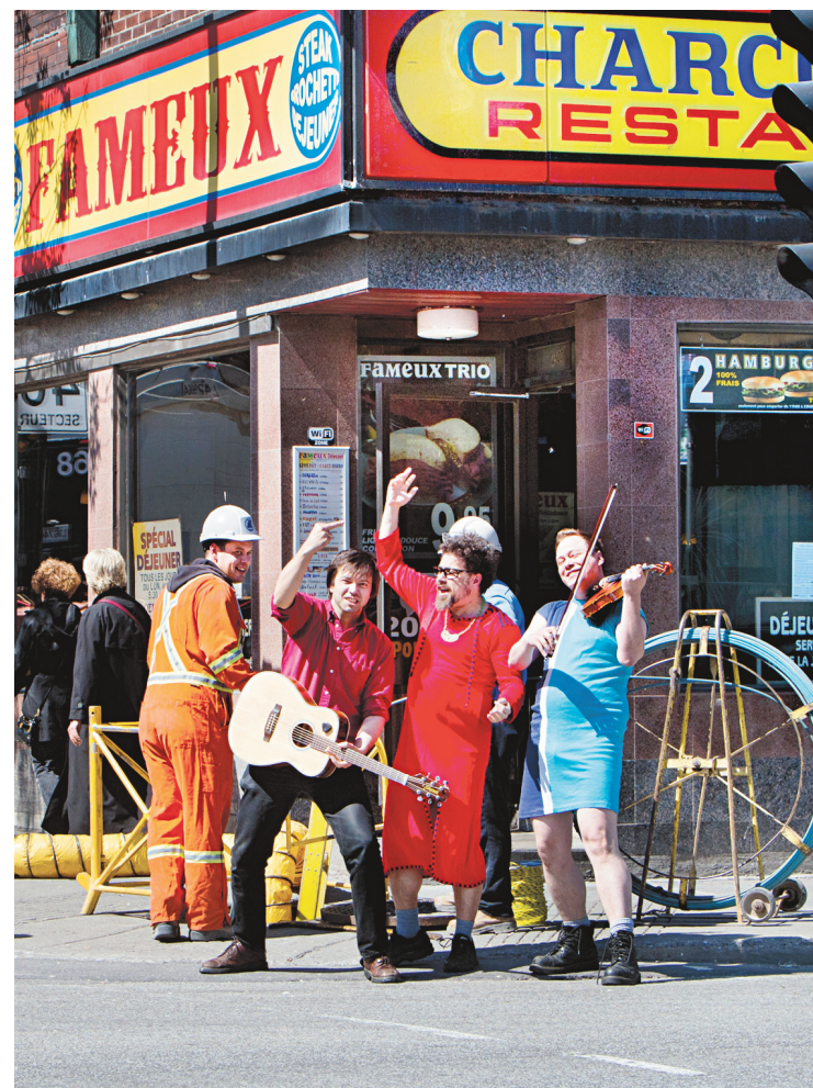
ANNIK MH DE CARUFEL LE DEVOIR

Mononc' Serge, quand même plus connu et diffusé que les zigotos des Abdigradationnistes, ne parle jamais du contenu parfois trivial de ses chansons. « C'est un sujet semi-tabou. Quand je suis passé à Tout le monde en parle, elle m'a dit: "Ça-tu du bon sens