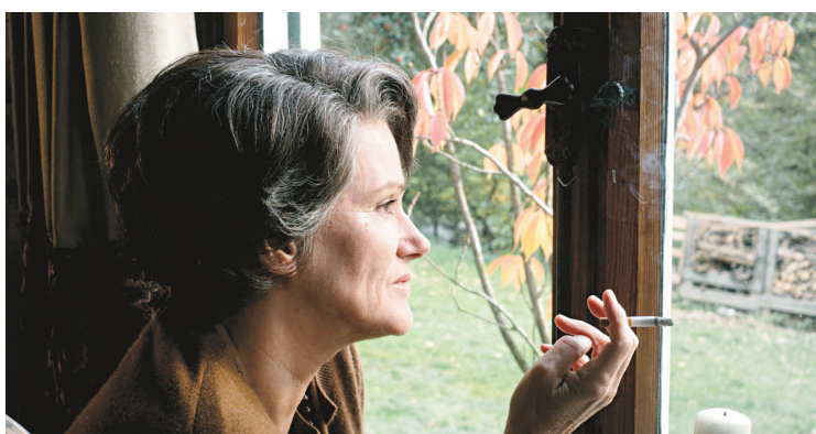
À Barbara Sukowa incombe la tâche de camper un personnage très brillant et implacable, mais gardant une humanité.