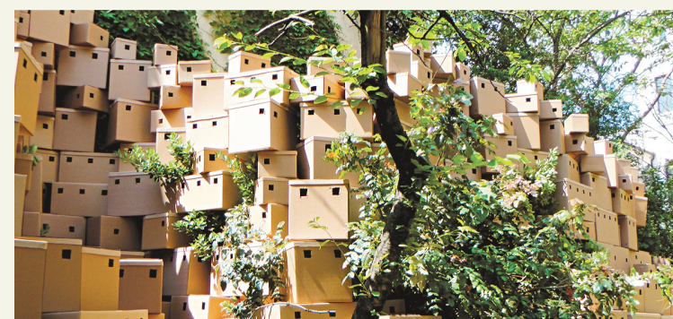
AVEC LA PERMISSION DE LA AL-HOASH GALLERY, JÉRUSALEM

D Voir aussi - Un survol en images des incontournables de cette 55 e Biennale de Venise. ledevoir.com/culture/arts-visuels