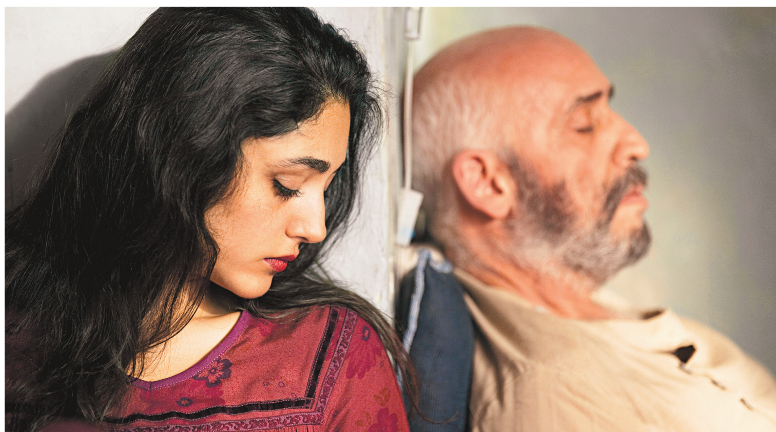
À travers le regard et surtout la parole d'un seul personnage féminin, ce sont toutes les femmes afghanes que le réalisateur Atiq Rahimi cherche à faire entendre, composant un rituel presque théâtral.

À l'exception d'une scène de prison en chanson ( Paroles , de Dalida et Delon, mimée par Joey Starr en « guest star »), la meilleure de Do Not Disturb , le film d'Attal est la copie au carbone de celui de Shelton. Mais là où le film de cette dernière s'incarnait grâce à des personnages plus vrais que vrais, et surtout bien définis, celui d'Attal s'enroule autour d'archétypes et de figures désincarnées, qui récitent le texte et miment les gestes sans avoir l'air de vraiment y croire. Du reste, on ne croit pas au couple Casta-Attal