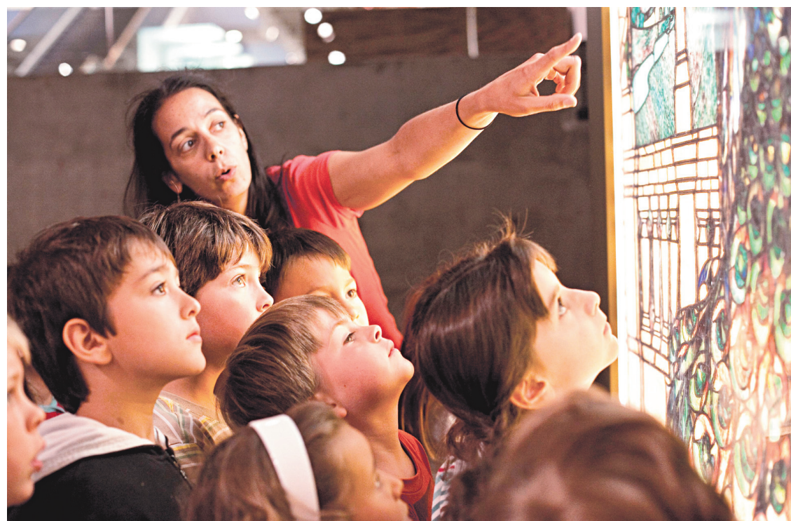
École d'été au Musée des beaux-arts de Montréal. Miser au départ sur une jeunesse à passionner pour l'art et ses merveilles est la voie royale pour l'avenir culturel.

Le mécénat culturel n'est pas inscrit dans notre ADN collectif pour la simple raison que la culture n'y figure pas non plus. Œuf et poule trinquant au nid en bonne amitié.