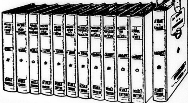
RELIURE BLEUE — TITRES DORES

Pour le propriétaire, le gérant ou les chefs de services