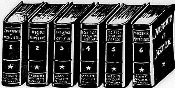
RELIURE ROUGE MANDARIN