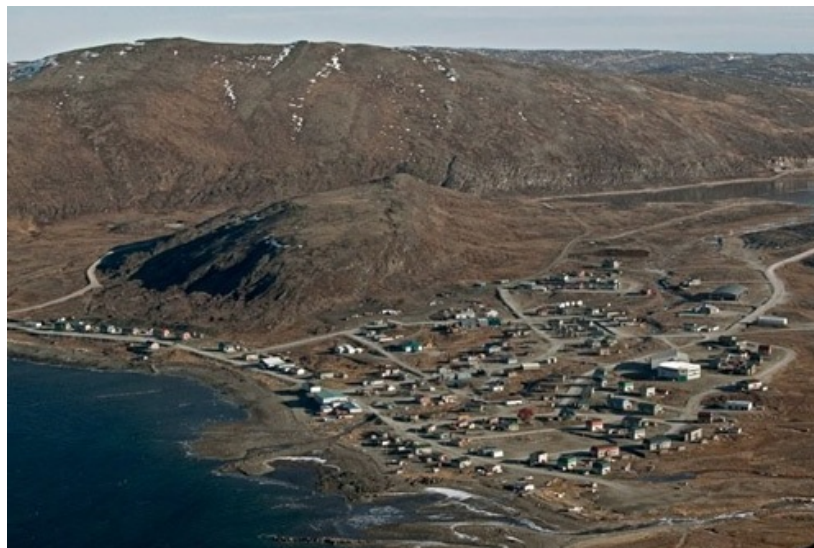
La ville de Kangiqsujuaq au Nunavik.