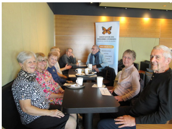
Première rencontre à Trois-Rivières ouest pour un Café Rencontre au CAFÉ MORGAN. Ce 2eme jeudi du mois du 14 mars 2024.

Ce fut une rencontre fort animée et conviviale. Merci aux participants.