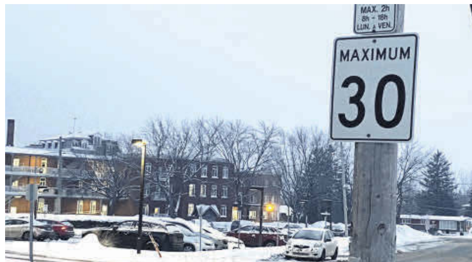
Des panneaux de vitesse, officialisant que la vitesse maximale est de 30 km/h, seront bientôt installés sur la rue Bergeron et dans un secteur de la rue Ricard.

Ce dernier croit qu'il y a encore trop d'automobilistes qui roulent à une vitesse excessive.