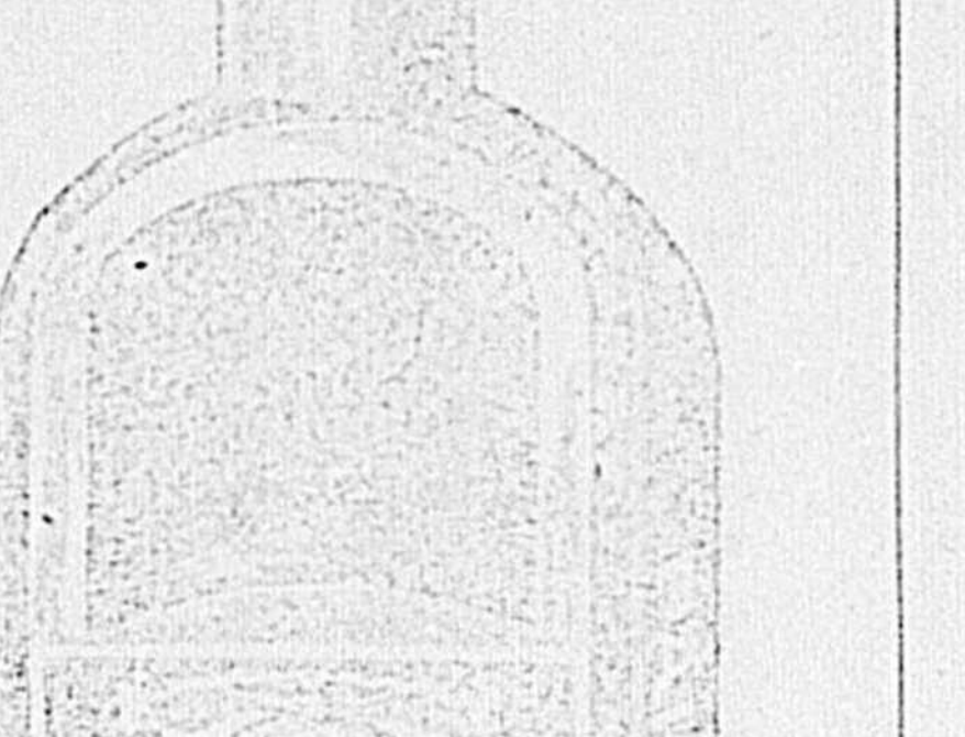
L'ancien Prix Populaire 25c.

La plus grande nouveauté du temps moderne!