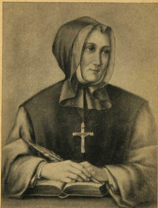
Marguerite Dufrost de Lajemmerais veuve d'Youville (1701-1771)