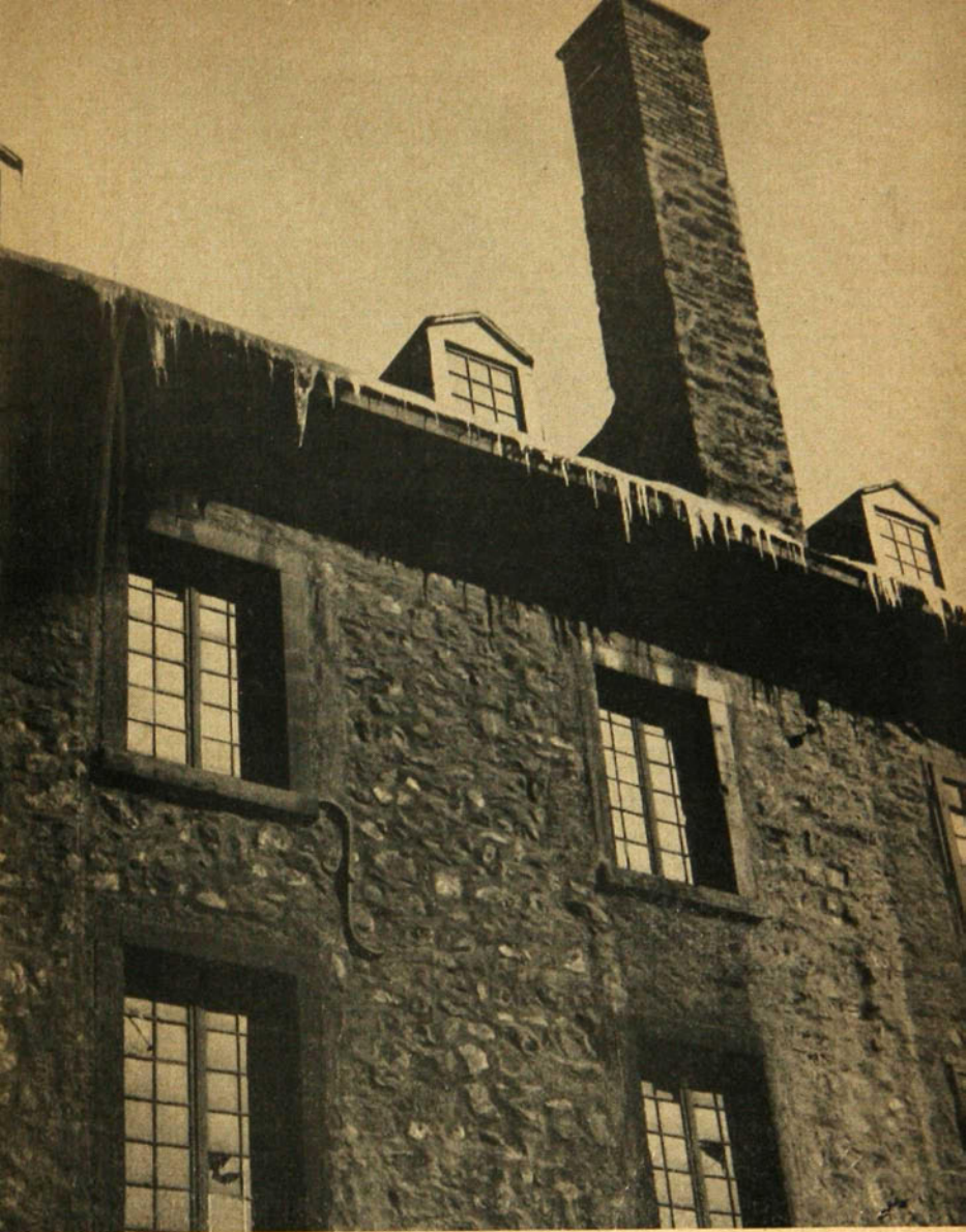
Le vieil Hôpital général où mourut la Vénérable. Cet édifice est encore visible près de celui des Douanes au Carré Youville.