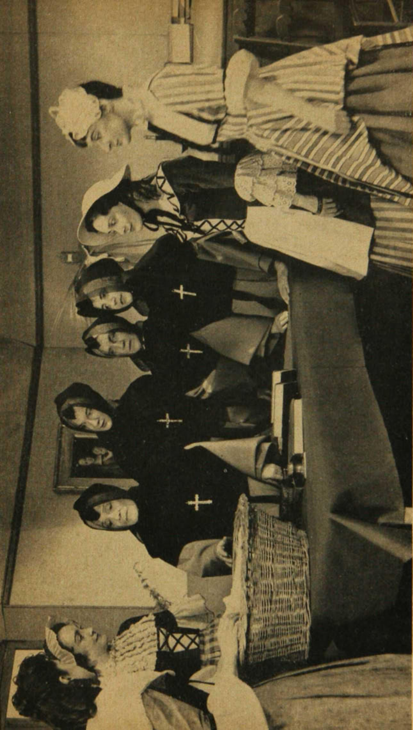
A la télévision on signale le caractère charitable de Mère d'Youville dans le désarrois de la Conquête.