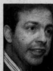
Le ministre Sam Hamad

Le journaliste se demandait si Hydro-Québec avait mis en place des mesures de sécurité spéciales à la