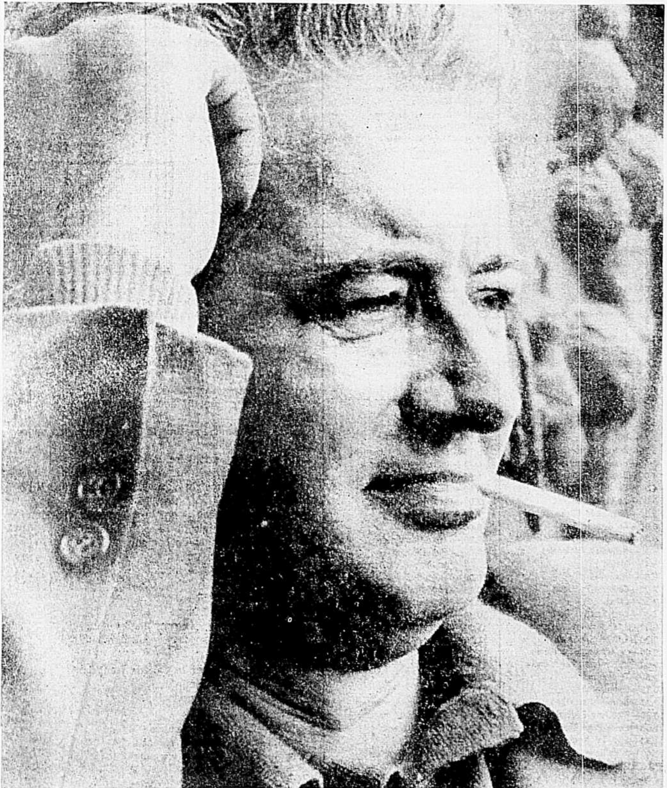
Félix Leclerc à la télévision, le dimanche 10 mars, à 9 heures ● voir article à la page 4