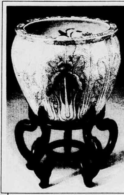
CACHE-POT DE PORCELAINE, PEINT À LA MAIN, 24" H.