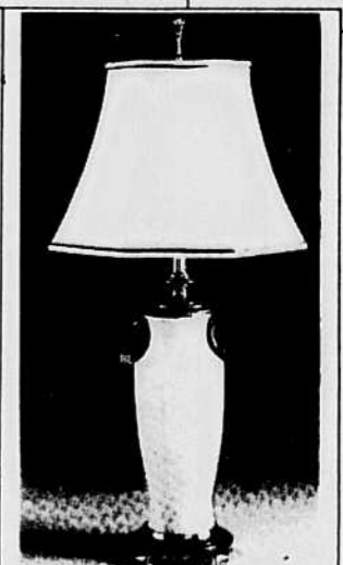
LAMPE PORCELAINE ET LAITON, 32" H.