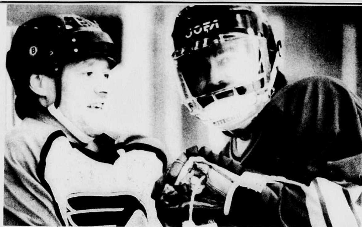
Certains respectent la loi d'autres pas. Le joueur que l'on retrouve à gauche ne respecte pas les normes de la Régie de la sécurité dans les sports alors que celui de droite se conforme à toutes les règles avec sa visière et son protège-cou.