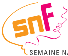
Table nationale en éducation

Table nationale de développement de la petite enfance