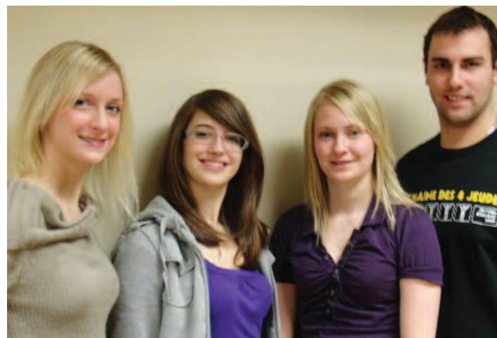
Stagiaires de l'Université du Québec à Chicoutimi

sentiment d'appartenance à la francophonie, en plus de leur fournir l'occasion d'expérimenter pendant leur séjour de nouvelles stratégies d'enseignement.