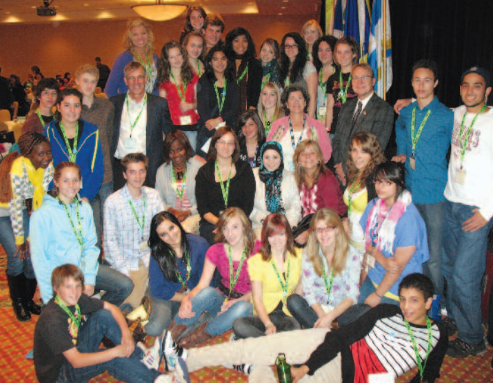
Ces 47 jeunes ont démontré leur engagement. La francophonie canadienne est entre bonnes mains !