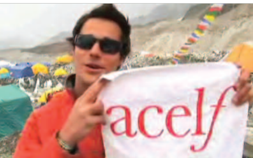
Grâce à WIGUP, les élèves ont suivi l'alpiniste Élia Saikaly dans son expédition jusqu'au sommet de l'Everest.

Le guide Pour une jeunesse active et fière a été mis en ligne sur le site de l'ACELF. Cette ressource pratique abonde en pistes de réflexion à l'intention de l'intervenante ou de l'intervenant qui veut ponctuer le quotidien de l'école d'activités qui apporteront une valeur ajoutée sur le plan de la fierté et de l'identité.