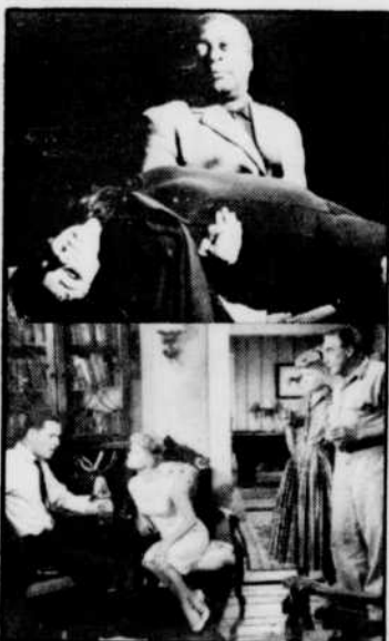
«La Mariée est trop belle», jeudi à 23 h 40. (à gauche) «La Nuit des vampires», lundi à 23 h 40. (à droite) «Comment dénicher un mari», mardi à 19 h 30. (à droite)