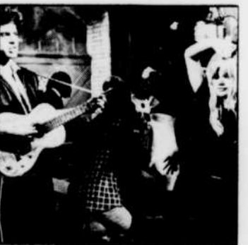
«Le Dernier Passage», jeudi à 13 h 00. (à gauche). «Les Dieux sauvages» vendredi à 23 h 40. (à droite)