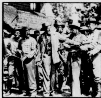
«La Patrouille égarée», dans la nuit de samedi à dimanche à 1 h 15. (à gauche) «La Bagarre de Santa Fe», lundi à 11 h 15. (à droite)