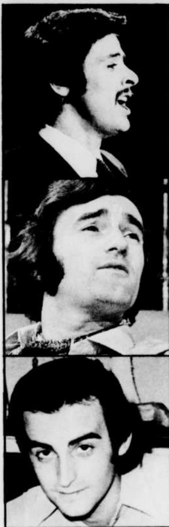
Ci-dessus: Donald LAUTREC, Joël DENIS, Dick RIVERS.