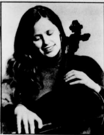
Jacqueline DU PRÉ, violoncelliste, sera l'invitée d'«Avec ou sans soleil», présenté du lundi au vendredi à 16 h 30.