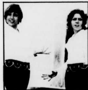
Ci-dessous: Les SCARABÉES. A droite, en haut: Renée CLAUDE et France GALL.