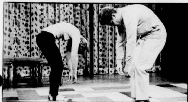
«En mouvement» vous revient du lundi au vendredi à 10 h 30.