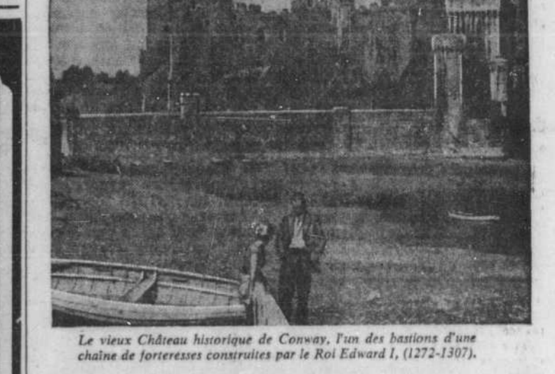
Le vieux Château historique de Conway, l'un des bastions d'une chaîne de forteresses construites par le Roi Edward I, (1272-1307).

Achetez SÉLECTION de février aujourd'hui: plus de 30 articles d'intérêt durable!