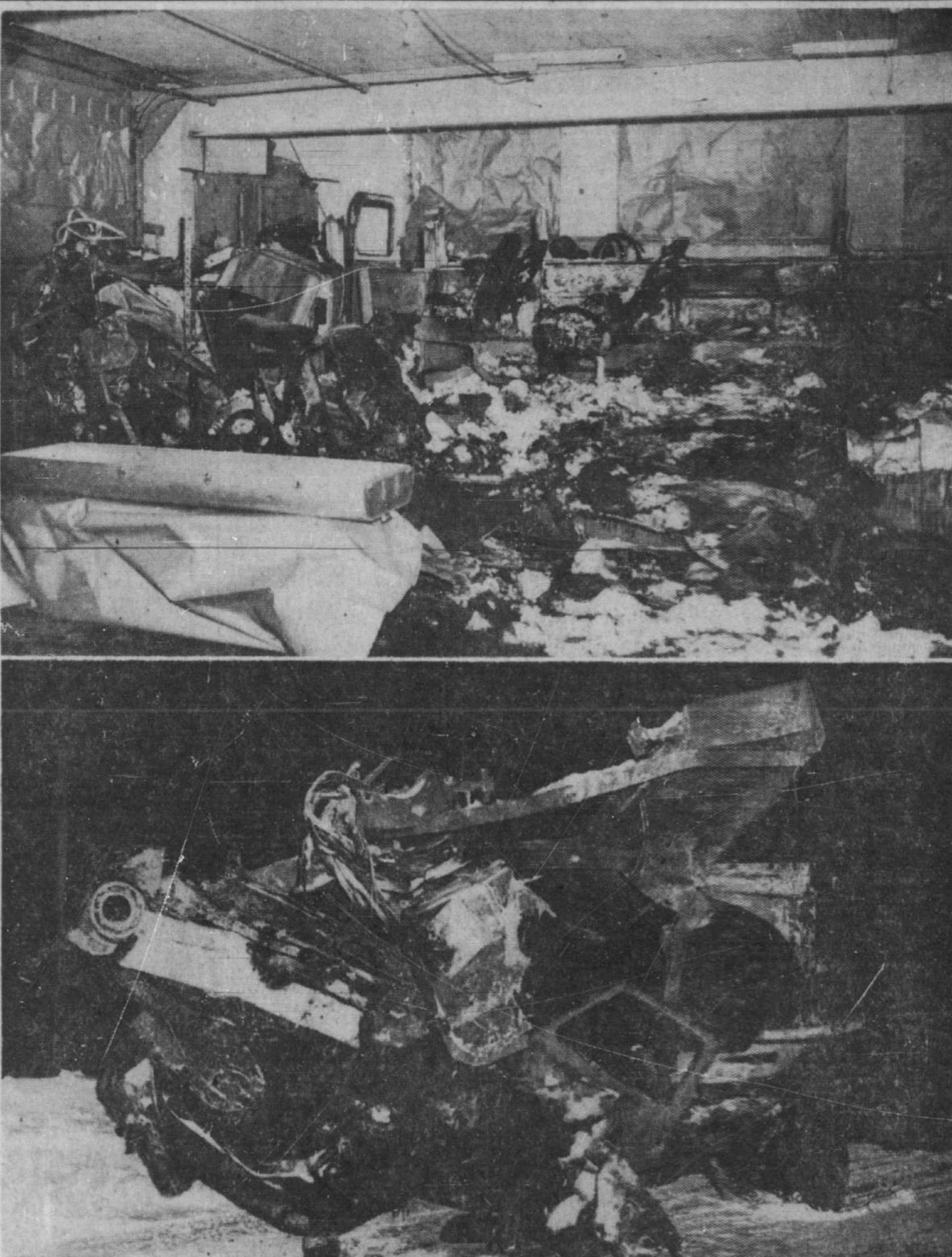
TERRIBLE DRAME DE LA CIRCULATION: On voit ci-dessus les deux véhicules qui sont entrés en collision, samedi soir, sur la route Québec-Montréal à Yamachiche, collision qui a causé la mort de quatorze personnes. En haut, l'intérieur calciné d'un autobus de Provincial Transport. La photo fut prise après que les sauteurs eurent terminé leurs recherches dans les débris du véhicule que l'on avait tiré jusqu'à la morgue de Trois-Rivières.

M. Eden a tenté de dépasser les craintes de Moscou vis-à-vis de la Communauté européenne de défense, au cours de ses commentaires d'aujourd'hui.