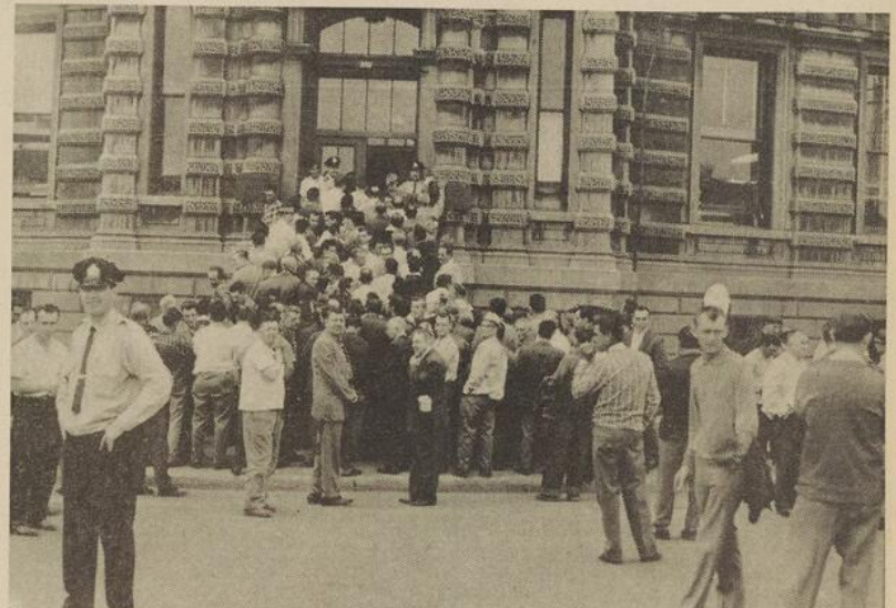
Les nombreuses grèves qui ont éclaté ces derniers mois dans différents secteurs du monde ouvrier sont le signe d'un malaise réel au sein de celui-ci. Les syndicats dits "internationaux", pour leur part, ont à résoudre le problème que pose pour eux leur double allégeance au Congrès du Travail du Canada et à différentes centrales américaines. La C.S.N., par ailleurs, n'a pas ce problème : elle est entièrement dirigée à partir du Québec et par des Québécois...