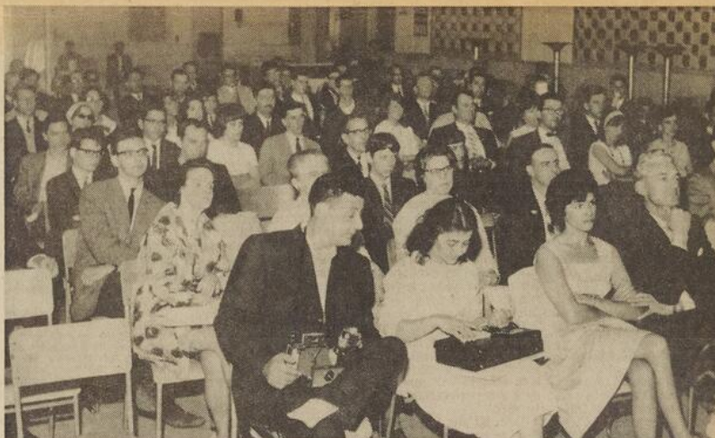
Quelque deux cent personnes, dont une quarantaine venues en autobus de Montréal, ont assisté à la convention du 27 juin dernier. Elles ont manifesté un enthousiasme qui augure bien.