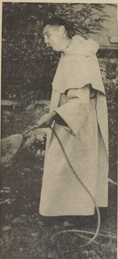
"...ceux qui puisent à la source d'eau vive, dans une religion bien comprise, les forces nécessaires pour bien gouverner l'Etat..."