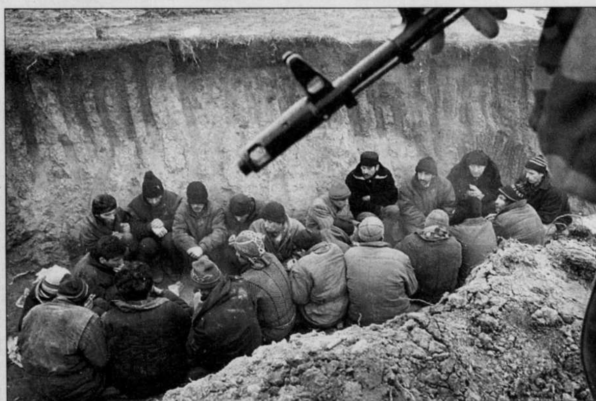
Des Tchétchènes, arrêtés par les forces russes pour ne pas avoir de papiers d'identité, attendent dans une tranchée où ils sont détenus pour le moment.

Le vice-président tchétchène est mort au combat