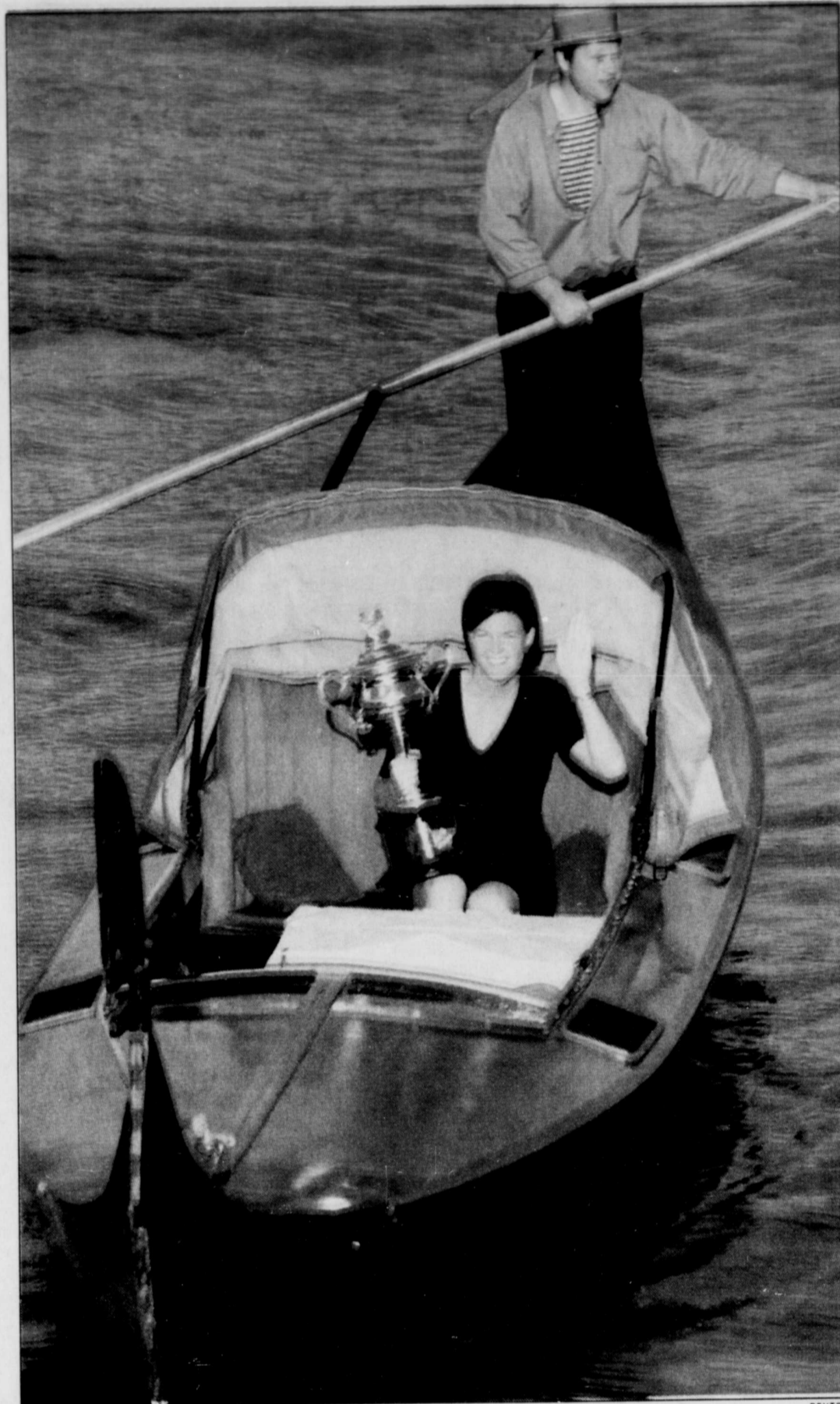
Quoi de mieux qu'une balade en gondole pour relaxer, comme l'a fait Lindsay Davenport, hier.

« Pendant quelques jeux, j'ai perdu le fil, a ajouté Davenport. Mais j'ai toujours cru que je pouvais m'en sortir. Quand on a une blessure, même si elle ne m'a pas trop gênée aujourd'hui, on