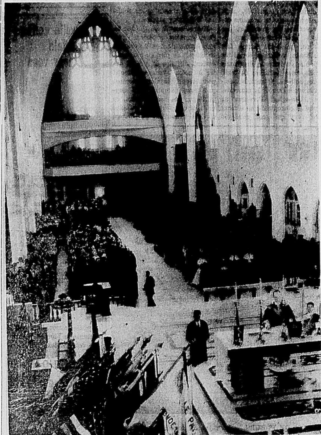
Voici un des aspects que présentera la télédiffusion de la Grand-messe, directement de la Cathédrale de Sherbrooke, à 9 h. 30, chaque dimanche matin, à partir du 23 février.