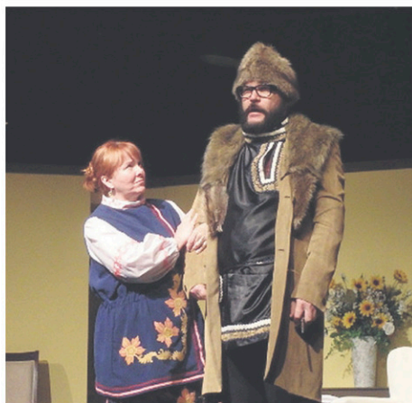
Les Boutons d'Art ont offert un rendez-vous théâtral des plus appréciés au théâtre LER de Dalhousie.

La troupe Les Boutons d'Art nous fait le bonheur cette année de se déplacer à la salle Alma d'Atholville le