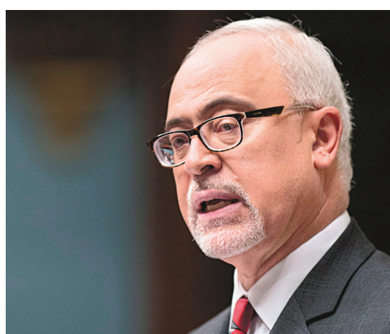
Le ministre des Finances, Carlos Leitao

L'agence se questionne entre autres sur la croissance des dépenses en santé, qui ont grimpé en moyenne de 4,2% par an au cours des cinq der-