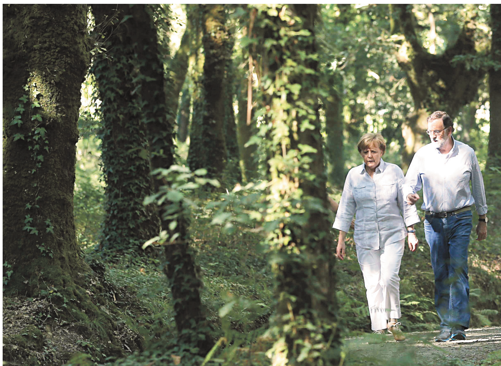
Près de Saint-Jacques-de-Compostelle, la chancelière Angela Merkel marche dans un sentier aux côtés du premier ministre espagnol, Mariano Rajoy.