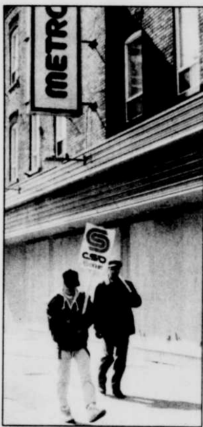
Cette photo fut prise le 23 avril dernier, environ deux semaines après que l'employeur eût créé un lock-out. Le piquetage est toujours en vigueur.

Les travailleurs et travailleuses avaient alors indiqué qu'ils présentaient une telle action, puisque leur employeur s'y préparait depuis un bon moment. Une baisse de l'inventaire hors saison en était, selon les syndiqués, le signe le plus évident.