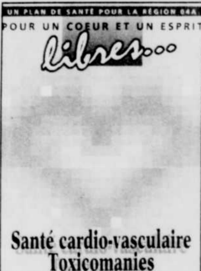
C'est ainsi que se présente la brochure d'information du DSC du centre hospitalier régional de la Mauricie.

Le DSC insiste également pour dire que ce plan de santé est l'affaire de tous, non seulement ceux qui dispensent les soins de santé, les intervenants sociaux, mais aussi le monde de l'éducation, du travail et les groupes communautaires.