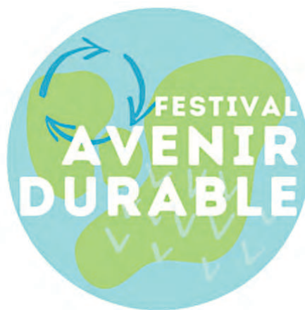
JEDD présente un premier événement virtuel pour le Jour de la Terre.

Le tout sera diffusé dans les écoles participantes et également en direct sur le Web. JEDD a d'ailleurs offert la possibilité aux écoles de procéder à un autre petit concours, qui avait pour but d'envoyer un mot de bienvenue aux organisateurs afin de choisir le meilleur