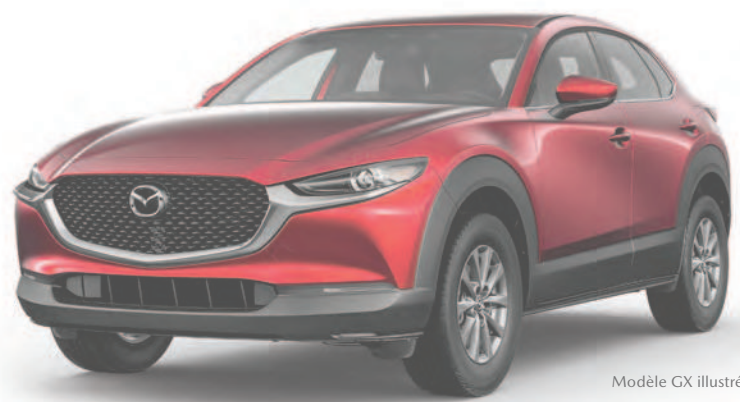
Modèle GX illustré

CX-30 GX 2021 AVEC LA TRACTION INTÉGRALE I-ACTIV