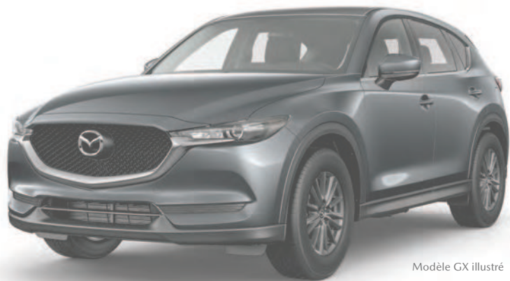
Modèle GX illustré

CX-5 GX 2021 AVEC LA TRACTION INTÉGRALE I-ACTIV