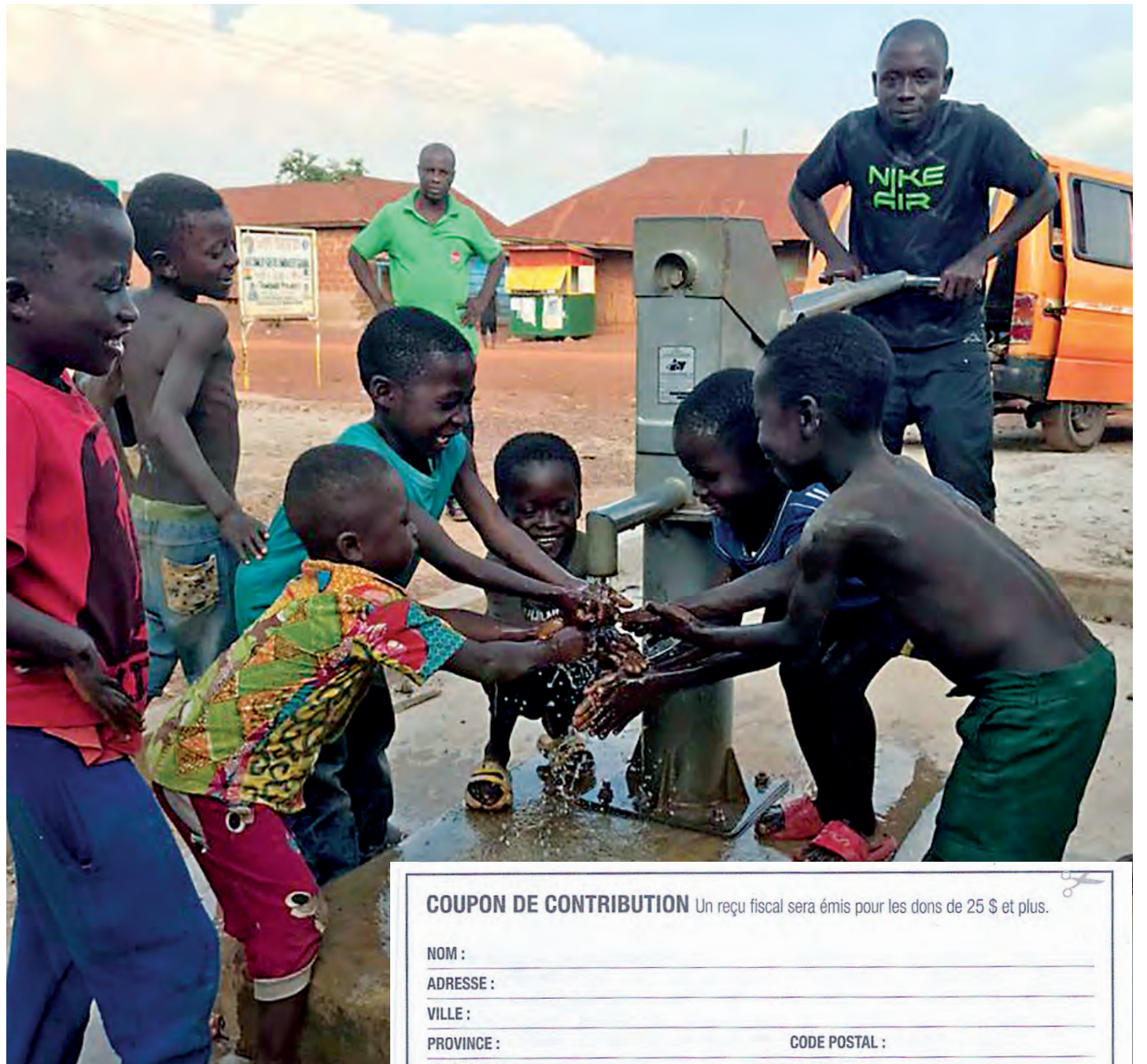
Un projet d'eau au Ghana.

Survolons l'océan Atlantique pour retrouver la région de Jérémie, en Haïti. Un projet estimé à 2500 $ consiste en l'installation d'un système électrique par source solaire destinée à un centre de formation situé dans un secteur qui n'a pas accès au réseau électrique. Plus de 500 personnes bénéficient de ce centre.