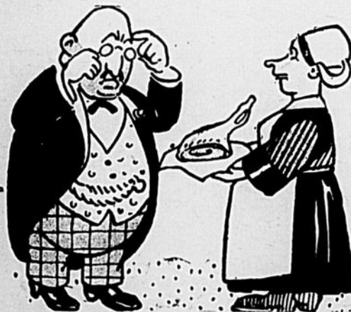
—Une piastre ce petit gigot-là! Allons, je vais être obligé d'augmenter encore mes lo-cataires.

Le célèbre Caruso vient de signer un contrat valable pour une saison de deux mois à Buenos-Ayres. Les appointements y sont spécifiés. Oif! une bagatelle!... 31.250 francs par soirée. Et dire que l'on reproche à nos élus leurs pauvres 15.000 francs par an!... Il est vrai que s'ils parlent bien, Caruso chante mieux. Mais, tout de même, c'est lui qui a trouvé le bon filon... le filon d'or.