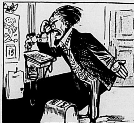
—Espèce d'insolent! Je ne sais pas ce qui me retient de vous flanquer ma main sur la figure.