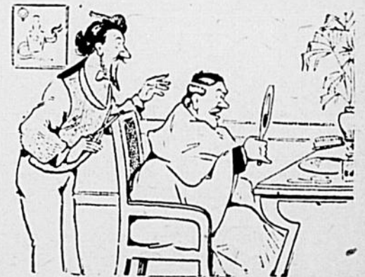
—Eh bien! maintenant que mes moustaches sont coupées, je m'aperçois que ça ne va pas du tout. —Nous aurions dû en couper la moitié seulement, afin de juger de l'effet!