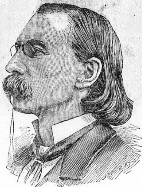
M. PAMPHILE LEMAY.