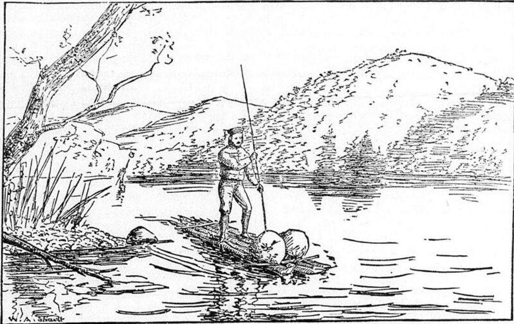
SUR LE SAINT MAURICE—PRÈS LA TUQUE.