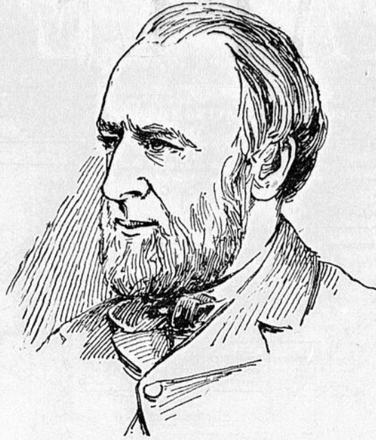
JAMES MCPHERSON LE MOINE.

The name of JAMES MCPHERSON LEMOINE has so long been associated with the history, archaeology, botany, ornithology, fisheries, chase, legendary lore, old customs and rites, of his native province, Quebec, through his numerous works on these various subjects, that he is regarded as the main authority on them, and his beautiful home, Spencer Grange, is the Mecca to which the historian, student, antiquarian, and men of letters of this continent and Europe turn their footsteps when visiting Quebec. Many of them have acknowledged their indebtedness to Mr. LeMoine for the inspiration and data upon which they have built their superstructures of romance or history. The most powerful novel ever written by a Canadian novelist, Le Chien d'Or , by William Kirby, was founded upon facts gathered by Mr. LeMoine into a sketch with the same title. But let us tell the story in Mr. Kirby's own words: