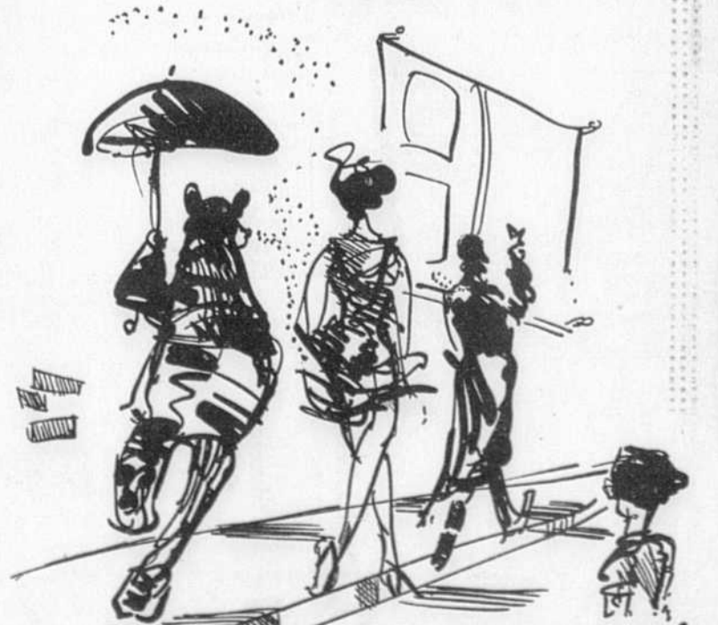
DESSIN BRUCE ROBERTS

J'ai senti un ton de doux reproche dans sa voix. Gêné à mon tour, j'ai pressé le pas. Des postes de... Comme c'est intéressant, me disais-je. Un grand type efflanqué m'a rattrapé et, sans aucune raison, m'a lancé: — Moi, j'ai 39 ans. Toi, est-ce que t'as 38? — Non, mais je vais sûrement y arriver un jour. En fait, il avait l'air plutôt jeune et son allure dégingandée donnait l'impression de quelqu'un qui aurait grandi trop vite. Il a ajouté sur le ton de la confiance: