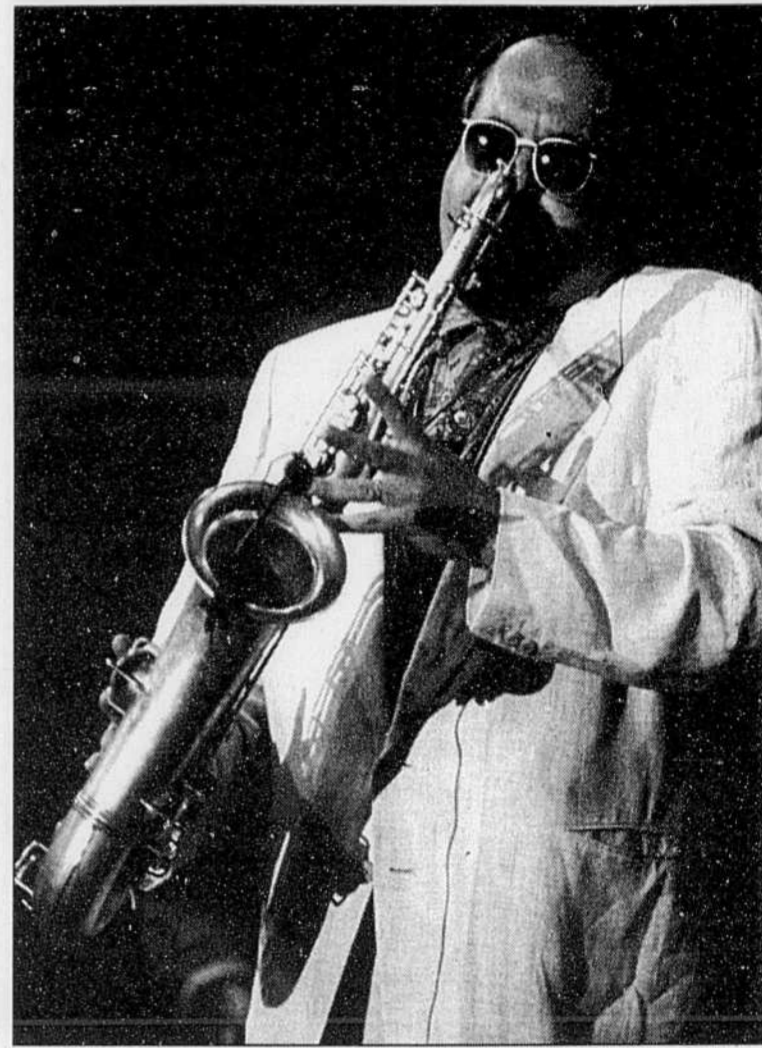
Joe Lovano: la pesanteur comme dénominateur commun.