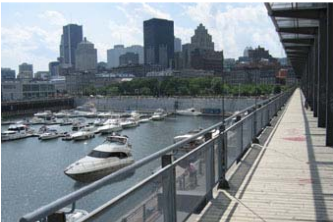
Quais du Vieux-Port de Montréal