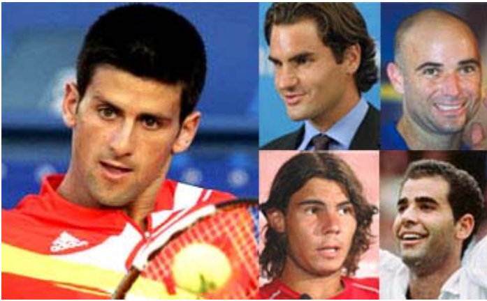
Novak Djokovic, Roger Federer, Rafael Nadal, André Agassi et Petes Sampras

Le nouveau champion de tennis de la Coupe Rogers à Montréal, Novak Djokovic (20 ans) a vaincu Roger Federer (26 ans), celui qui était le favori de la foule. Cette situation est frustrante pour les spectateurs mais elle se répète souvent. Il y a deux ans, Rafael Nadal (21 ans) avait défait le favori André Agassi (37 ans). Cette année, c'est Nadal qui s'est fait battre. Il y a quelques années, en 1995 à Montréal, Agassi avait défait le grand favori du public de l'époque, Pete Sampras . (36 ans). S'il y a une conclusion à retenir c'est que le titre de champion au tennis ne dure pas très longtemps et il vaut mieux pour les fans de ne pas trop s'attacher émotionnellement... (Voir éditorial de l'éditeur).