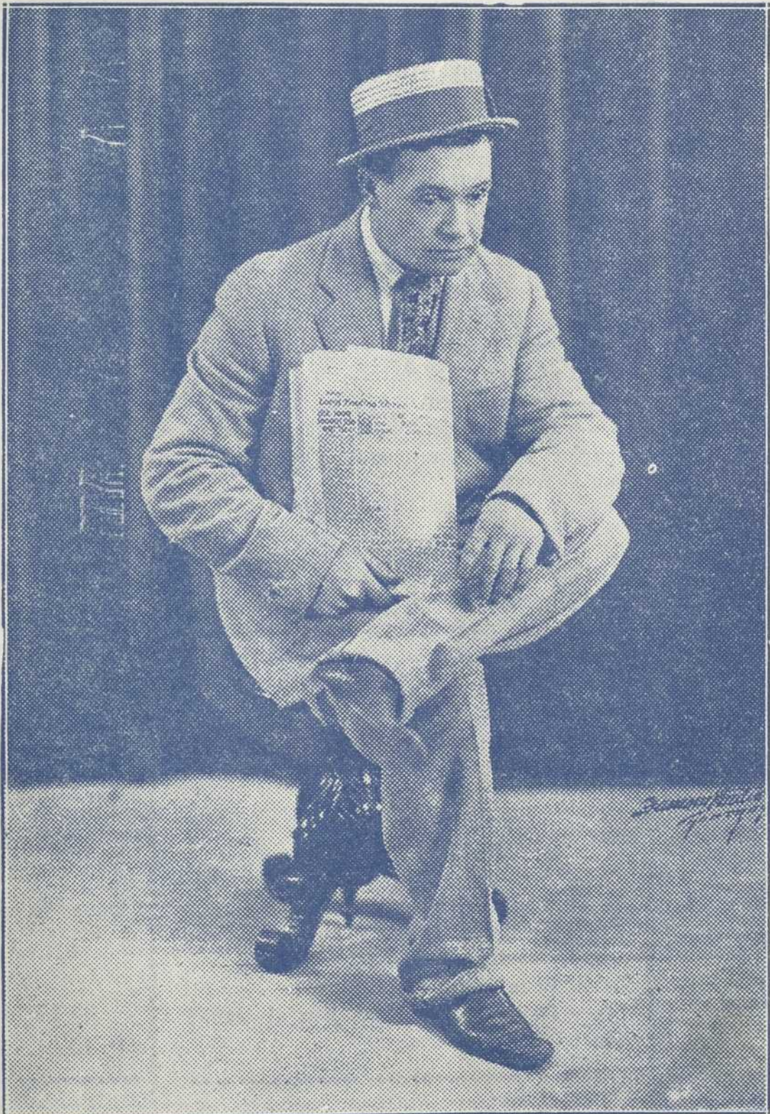
Tizoune lisant les rapports de la Bourse