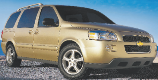
Equinox de Chevrolet