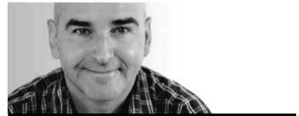
ALAIN BRUNET CYBERCULTURE

Le navigateur Web Mozilla est préféré à Explorer par un nombre croissant d'internautes. Linux est un système d'exploitation que d'aucuns estiment plus performant que Windows. Gabber est un logiciel de clavardage, Evolution est un service de messagerie électronique qui peut fort bien remplacer Outlook, Kppp permet d'accéder aux réseaux téléphoniques.