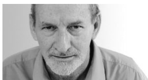
CLAUDE GINGRAS MUSIQUE

C'est demain soir et jeudi soir, 19 h 30, dans le cadre spectaculaire de la basilique Notre-Dame, que l'Orchestre Symphonique de Montréal présente son audition annuelle de Messiah — Le Messie , le célèbre oratorio de Handel racontant la Nativité, la Passion et la Résurrection du Christ.