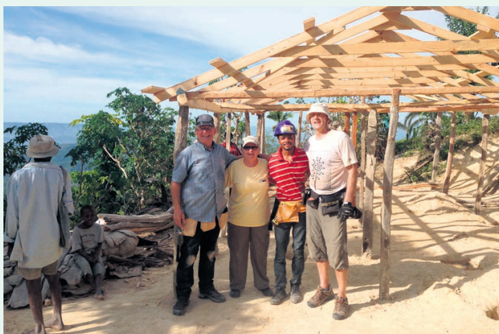
Quelques volontaires participant à la corvée qu'UPA DI organisait à Labrousse, en Haïti, en décembre dernier.

Sept des dix volontaires ayant participé à la corvée qu'UPA DI organisait à Labrousse, en Haïti, en décembre dernier, ont témoigné de leur expérience dans le cadre d'un midi-conférence qui a eu lieu le 8 mars à la Maison de l'UPA. L'équipe de bénévoles dit avoir beaucoup appris des rencontres faites dans ce village de montagne situé près de la ville de Mirogoâne, au sud-ouest de Port-au-Prince. « Les conditions y sont bien différentes des nôtres, que ce soit pour la construction, les outils, les matériaux et même l'électricité. Il a fallu s'adapter, faire preuve de savoir-faire et d'ingéniosité. » Les volontaires d'UPA DI n'ont que de bons mots pour les habitants de Labrousse, qui les ont étonnés par leur débrouillardise, leur habileté et leur soif d'apprendre. Ils s'estiment chanceux d'avoir eu la chance de vivre une expérience hors du commun au cœur de la population locale. ✕