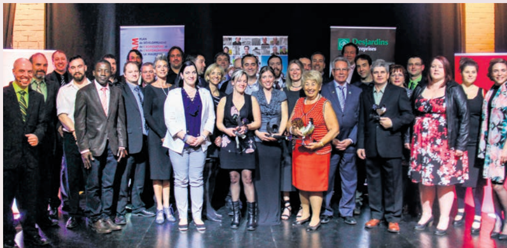
Tous les lauréats et finalistes sélectionnés du Gala.

La liste complète des lauréats est disponible au www.mauricie.upa.qc.ca/blogue/gala2017 . ✕