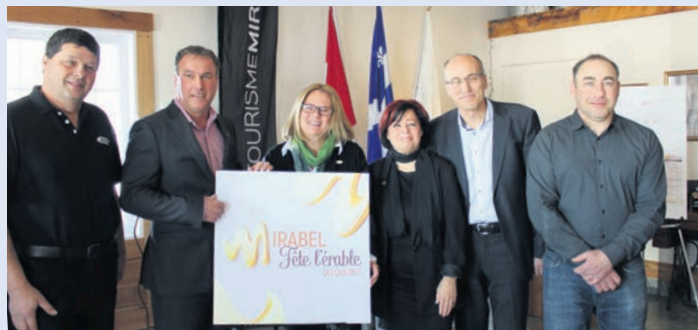
L'événement a été l'occasion de lancer l'initiative Mirabel fête l'érable.

La saison des sucres, c'est plus que l'eau d'érable, le sirop et la cabane à sucre. C'est tout un pan de notre patrimoine régional que l'on déguste et célèbre avec fierté et qui mérite un traitement spécial. Pour marquer le coup, Tourisme Mirabel et le Syndicat des producteurs acéricoles Outaouais-Laurentides ont invité, début mars, les acteurs de la communauté, les producteurs et les journalistes à la boutique Aux Saveurs du Printemps. Le commerce est la propriété d'une entreprise acéricole de Mirabel, active depuis 1891. Entre les dégustations, les allocutions et les prises de photos, les organisateurs en ont profité pour annoncer une série d'initiatives locales, qui mettent en valeur l'agrotourisme et les produits de l'érable du territoire. On peut visionner l'événement sur la page Facebook de la Fédération, dans la section Vidéos. ✕