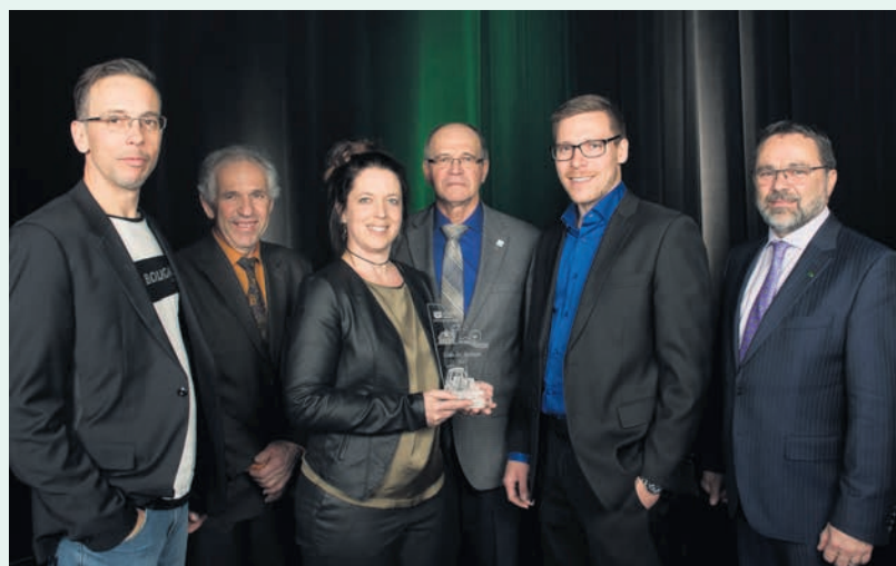
Dans la catégorie action collective, les lauréats sont les quelque 30 producteurs de l'Association du bassin versant du ruisseau Brandy, dans la région de Granby.