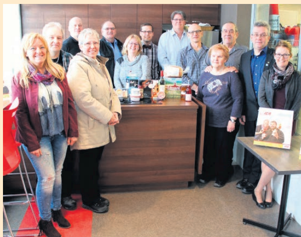
Les propriétaires de neuf entreprises agricoles locales décorent depuis quelques semaines les allées des magasins IGA Rodrigue et Filles et IGA Familles Rodrigue et Groleau, de Saint-Georges.

Des affiches présentant les propriétaires de neuf entreprises agricoles locales décorent depuis quelques semaines les allées des magasins IGA Rodrigue et Filles et IGA Familles Rodrigue et Groleau, de Saint-Georges. Ce projet de promotion de l'achat local est une initiative de la Fédération de l'UPA de la Chaudière-Appalaches avec l'appui des gouvernements du Québec et du Canada. Le dévoilement des affiches grand format a eu lieu le 14 mars au IGA Rodrigue et Filles. Voici les neuf fermes concernées : Beauceron à l'érablé, Miel GP, Boulangerie d'ici, Jardinier Huard, Les Roy de la pomme, La Pralinère, Ferme JN Morin, Laiterie Royale et Frampton Brasse. ✕