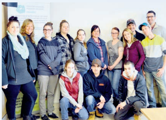
TABLE DE CONCERTATION POUR L'ENTRETIEN DES COURS D'EAU

Le Carrefour jeunesse-emploi d'Autray-Joliette a mis sur pied un projet novateur pour permettre à des jeunes qui ont déjà fait un stage d'intégrer un emploi dans une ferme. La FUPAL a ainsi dispensé à une cohorte de stagiaires une formation portant sur l'agriculture dans la région et sur l'offre du Centre multiservice agricole, forestier et bioalimentaire de Lanaudière. Le centre d'emploi agricole compte également organiser un atelier de prévention à l'intention de ces jeunes. ✕