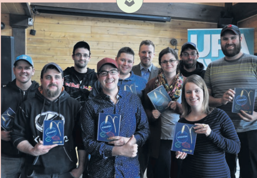
Les membres de l'ARAGIM et leur projet Aventure Relève, dont Le Passeport, un carnet de route contenant de précieuses informations.

Pour l'Association de la relève agricole de la Gaspésie-Les Îles (ARAGIM), la Journée Relève a été l'occasion de lancer Aventure Relève, un nouveau projet pour les jeunes gaspésiens et madelinots qui souhaitent se lancer en agriculture. Le projet propose trois outils : Les Éclaireurs, un service d'accompagnement de relève à relève; Le Passeport, un carnet de route qui réunit les informations indispensables à l'établissement; et La Route des fermes, une liste d'entreprises prêtes à accueillir des jeunes dans leur ferme et répondre à leurs questions. Informations : gaspesie-iles@upa.qc.ca ou 1 888 503-7455. ✕