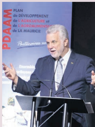
Le premier ministre du Québec, Philippe Couillard.

Présenté par Desjardins Entreprises et le Plan de développement de l'agriculture et de l'agroalimentaire de la Mauricie (PDAAM), le Gala Gens de Terre & Saveurs a sélectionné pas moins de 21 finalistes et 13 lauréats le 20 avril dernier, à Trois-Rivières. Plus de 250 acteurs des milieux agricole et agroalimentaire ainsi que de nombreux dignitaires s'étaient donné rendez-vous à cette importante cérémonie organisée par la Fédération de l'UPA de la Mauricie.