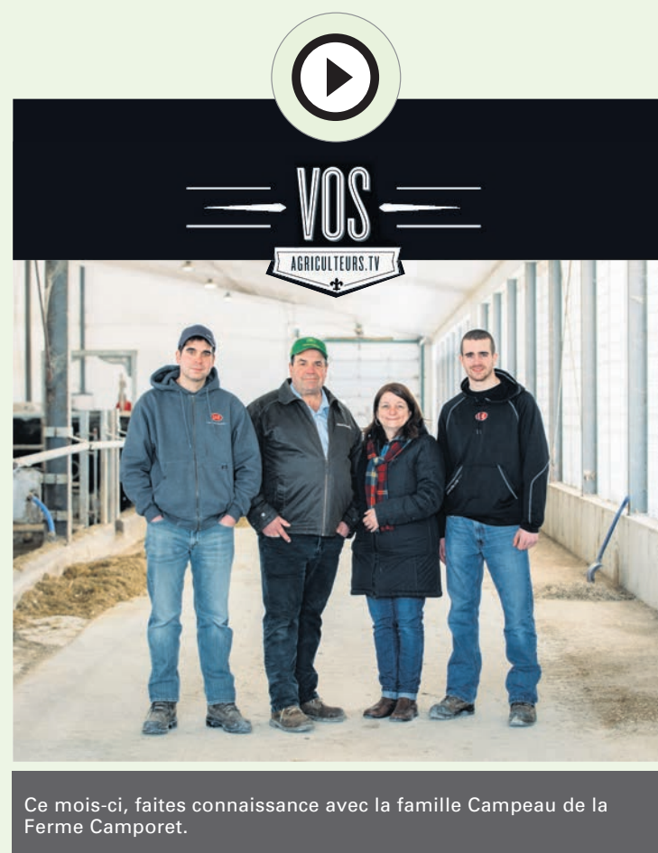
Vidéo réalisée avec le soutien de Financement agricole Canada.

La Fédération des producteurs forestiers du Québec a lancé une campagne afin de susciter l'adhésion des gens aux Amis de la forêt privée. En plus de faire connaître leur appui au développement de la forêt privée québécoise, les adhérents recevront un abonnement à la revue Forêts de chez nous et un exemplaire du guide terrain Saines pratiques d'intervention en forêt privée . Ils auront également droit à des rabais sur l'abonnement au journal La Terre de chez nous et sur la publication de petites annonces. Pour s'inscrire : http://bit.ly/foret-privée . ✕