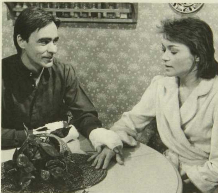
André Le Coz

Quatre jeunes femmes prennent en main leur vie, leur carrière et font face avec beaucoup de lucidité aux problèmes que leur pose leur situation sociale. Que ce soit au sein d'une agence de publicité, dans une clinique, dans un bureau d'avocat, Martine, Anne, Catherine et Michèle vivent des destins différents et pourtant on reconnaît chez l'une et l'autre une même volonté de s'affirmer, d'aimer, d'être aimée. Ainsi cette semaine, Martine devra mettre les bouchées doubles pour que son agence reprennent vraiment le dessus. Catherine pour sa part va chercher toujours à aplanir les difficultés qui surgissent dans la vie de ses filles alors qu'Anne s'inquiète au chevet du docteur Cordeau. La Bonne Aventure présentée les lundis à 20 heures met en scène des personnages attachants parce que modernes, vulnérables, humains et très près de la réalité que nous vivons tous les jours. Textes: Lise Payette. Réalisation: Louis Plamondon.