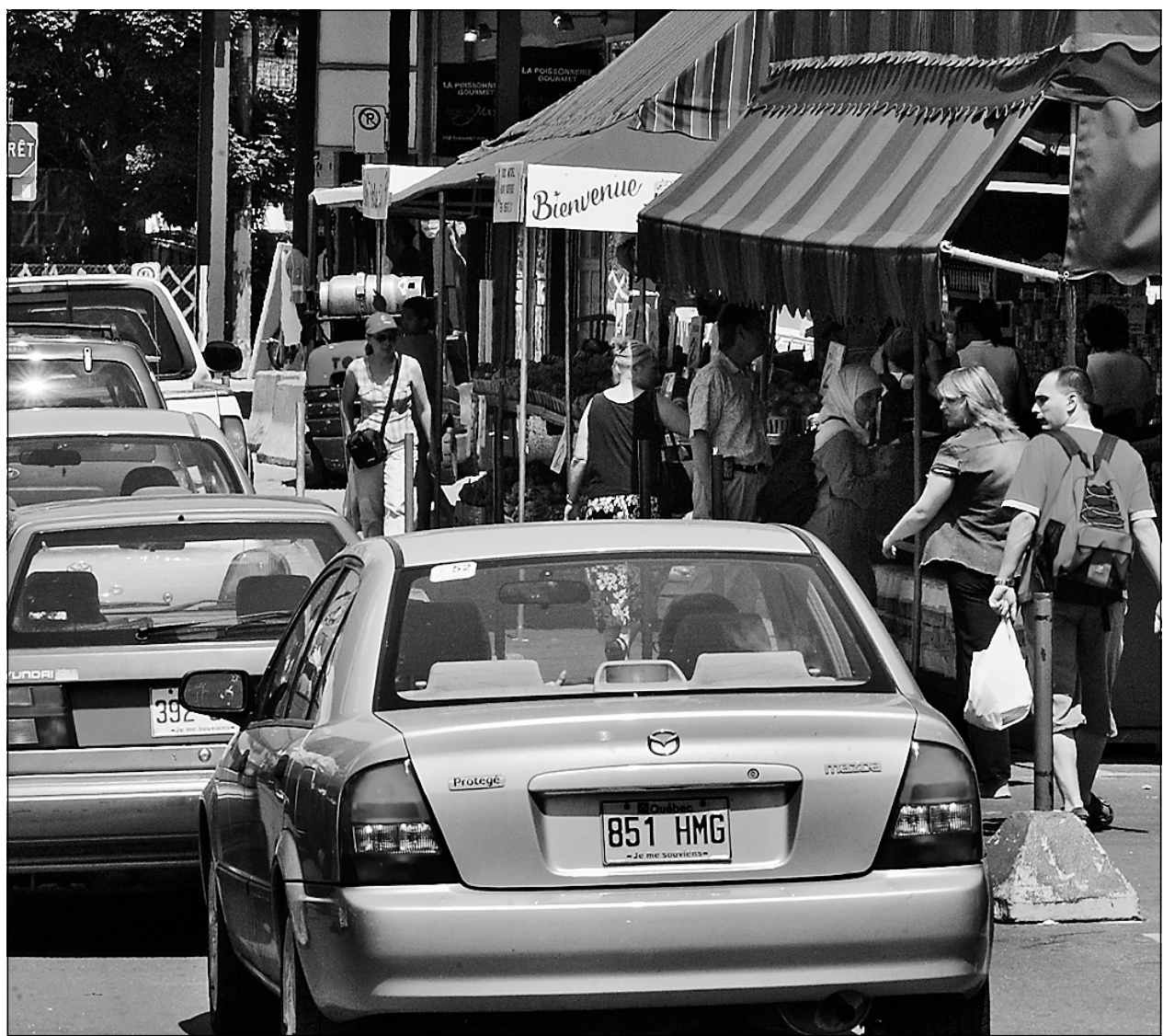
Le projet visant à interdire la circulation automobile au marché Jean-Talon pendant une partie du week-end soulève les passions.

Comme tous ceux qui vont au marché à pied, je suis parfois exaspérée par la présence des automobilistes. Et aussi par les poussettes de format Hummer. Et par ces frustrés pressés qui écrasent les ortels sans s'excuser. Vais-je exiger qu'on les barre de MON marché pour en faire une sorte de club privé où je pourrai enfin magasiner en paix en compagnie de gens comme MOI qui partagent MES valeurs