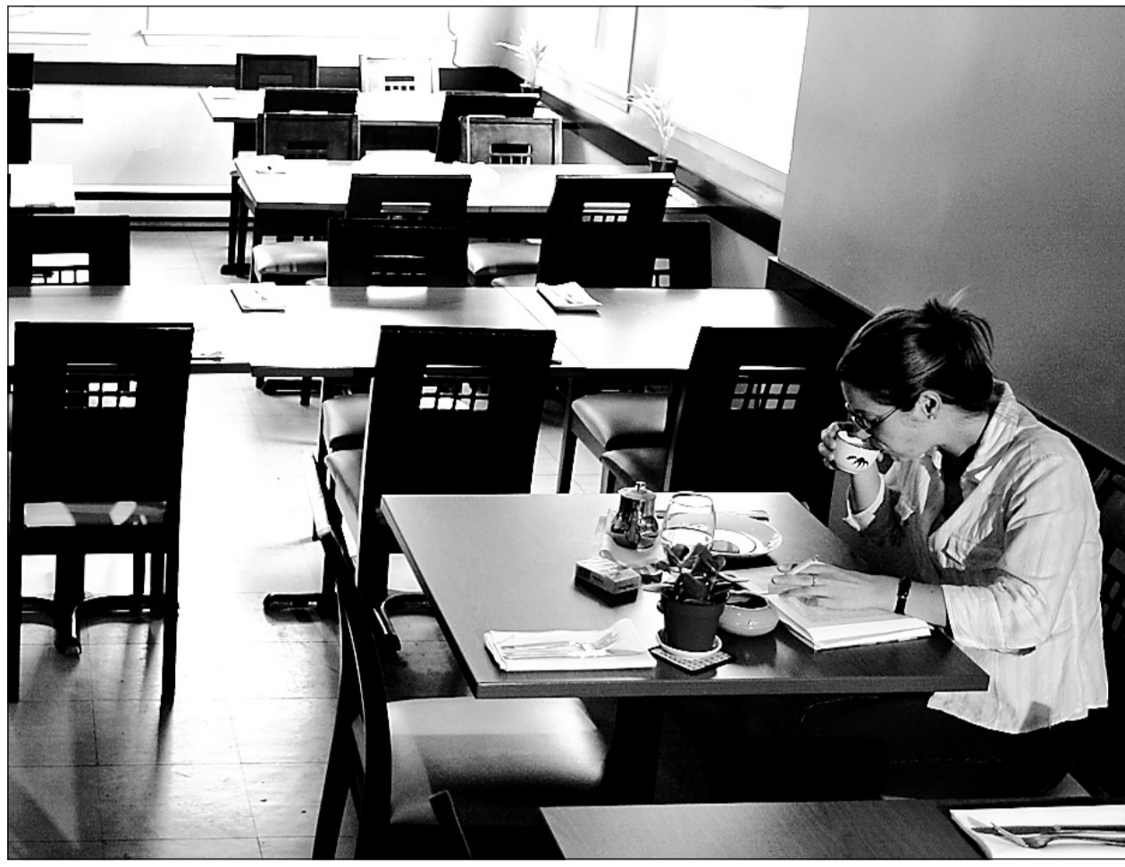
Le restaurant Bangkok propose une cuisine authentique, impétueuse et séduisante.

Au Bangkok (celui du Village), vous partez un peu à l'aventure, vous voyagez léger : cuisine sans artifice, très faible en gras, service amaigri, carte des vins utopique, quelques bières mais seulement si vous avez de la