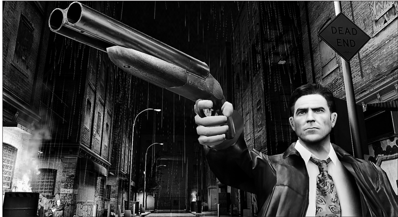
Un anti-héros qui passe de fusillades en trahisons...

C'est aussi la première fois qu'un FPS met autant l'accent sur les textes. Quelques extraits : « Le passé est un puzzle en miroir brisé. Quand on veut reconstituer les pièces, on se coupe. (...) Cet instant dans les dessins animés ou la gravité attend que le coyote réalise son erreur avant le plongeon. (...) Toutes les zones d'ombre de