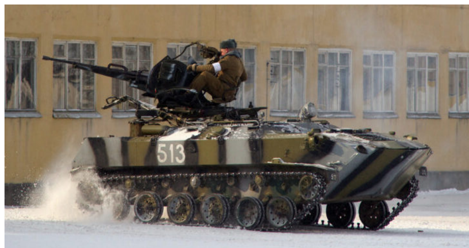
Soldat de l'armée russe sur un BTR-ZD.

Une attaque de missiles et drones russes sur des infrastructures énergétiques ukrainiennes a, le 26 août dernier, contraint les autorités à imposer des coupures de courant. Des ruptures sur le réseau de distribution d'eau ont aussi été constatées. Selon Kiev, 15 régions ont été ciblées simultanément.