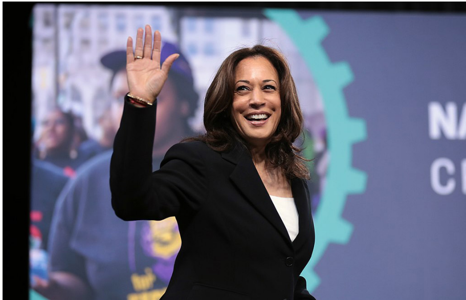
Kamala Harris lors du Forum national sur les salaires et les travailleurs de 2019. (Wikimedia Commons)

Lorsque j'ai ouvert mon Tiktok et vu un montage de Kamala Harris faisant référence à des arbres de noix de coco, sur une chanson tendance de Charli XCX cet été, j'ai su que Kamala Harris allait donner du fil à retordre à Donald Trump.