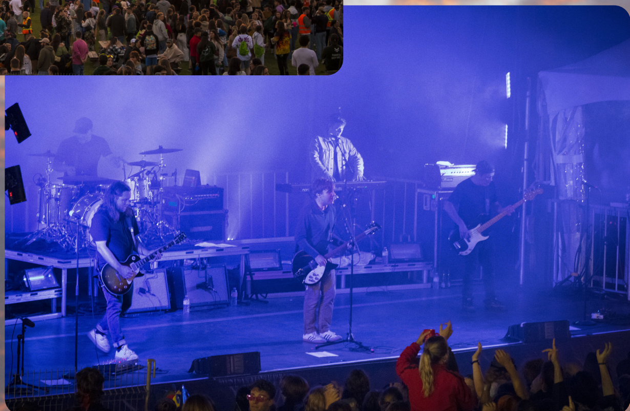
La partie la plus attendue: Les Trois Accords.