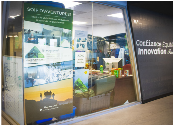
Le Club plein air Altitude de l'Université de Sherbrooke te permet de t'initier aux activités de plein air et de louer l'équipement nécessaire pour ta prochaine fin de semaine de camping. (Frédérique Richard)

Oui, oui! Le Club plein air, qui existe depuis le milieu des années 1980, te permet de vivre des fins de semaine de camping sans déboursier une fortune pour t'équiper. Il suffit d'être membre du regroupement en déboursant 10 $ par année pour avoir accès aux activités et à l'équipement à moindre coût.