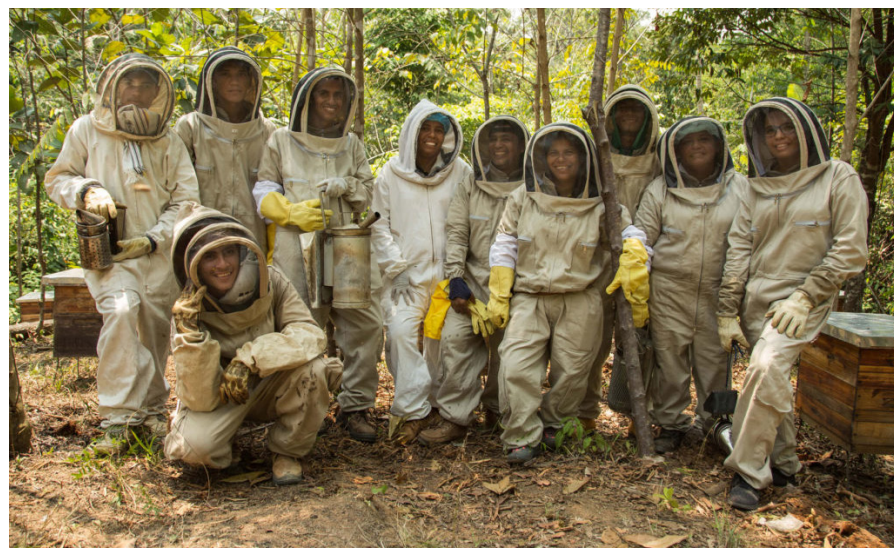
Des apiculteurs au travail.