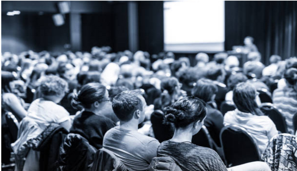
Photographie d'une foule.