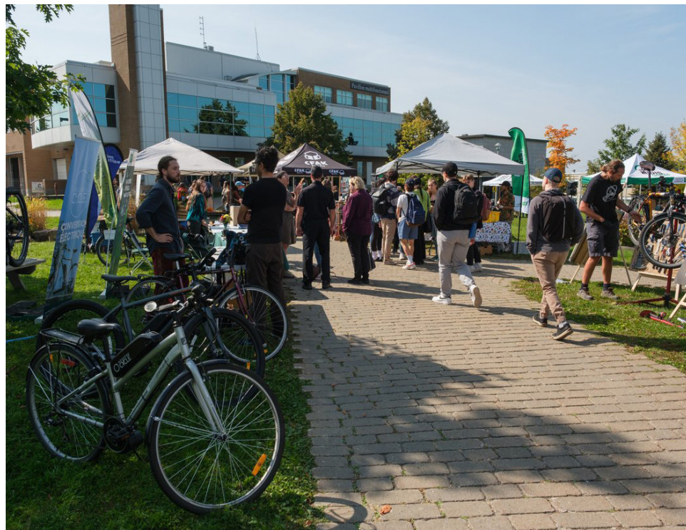
Le marché public au coeur du campus principal.

L'Université de Sherbrooke organise, encore cette année, un marché public au sein même de ses campus. Depuis quelques années, la rentrée est l'occasion pour la communauté universitaire de s'approvisionner en produits frais et se renseigner sur des initiatives locales, et ce, directement sur le campus.