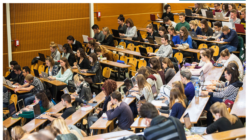
Personnes étudiantes qui assistent à un cours universitaire.

Devant un financement public insuffisant pour les