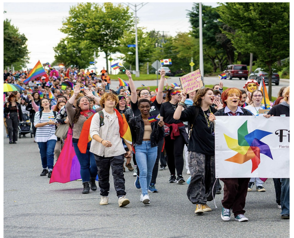
Édition 2023 de Fièrè la fête.

On attend en grand nombre chère communauté étudiante, au plaisir de t'y croiser!