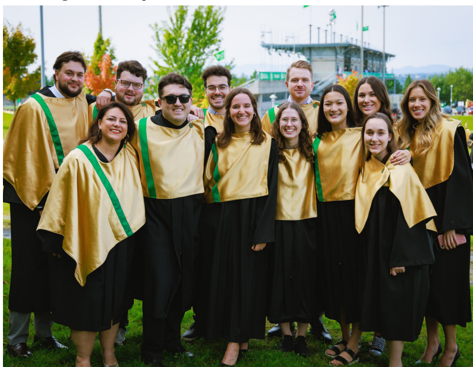
Des personnes graduées en études politiques appliquées lors de la collation des grades 2023. (Université de Sherbrooke)