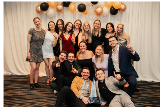
Les délégations chapeautées par le Comité de compétition de l'Université de Sherbrooke s'engagent à s'encourager entre elles lors des compétitions interuniversitaires.

Le symposium GRH n'aura pas lieu cette année, mais les Jeux du commerce se dérouleront du 10 au 13 janvier, l'Omnium financier du 7 au 9 février et le Happening marketing du 21 au 23 mars prochain. Rendez-vous sur la page Facebook du Comité de compétition pour tous les détails.