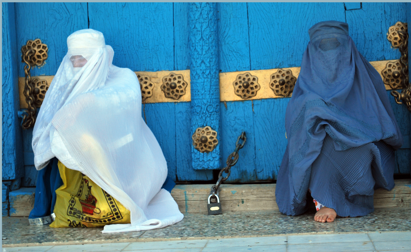
Deux femmes assises devant une mosquée. (Flickr Amina Morave).