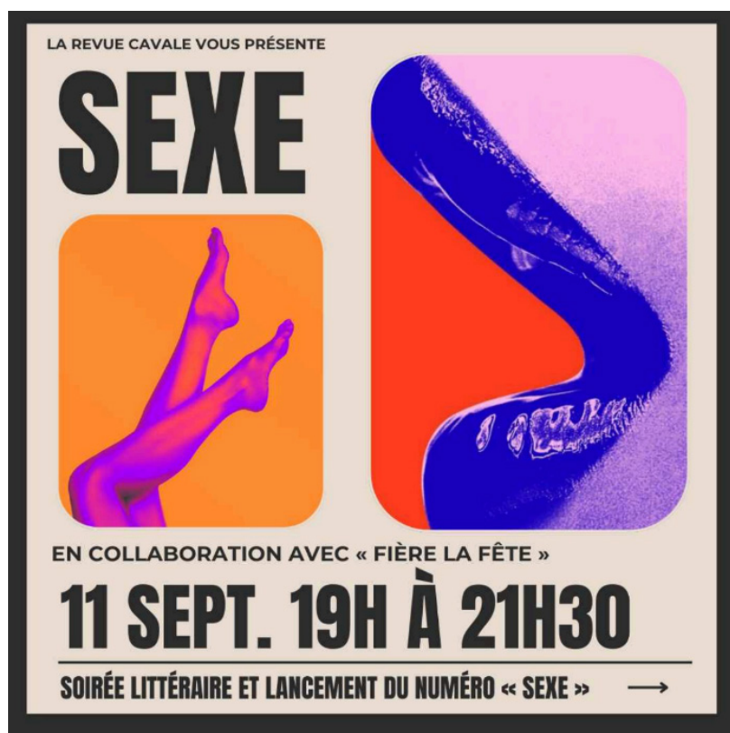
Affiche promotionnelle du lancement de la revue Cavale. (Cavale)

Ça vous allume? Visitez le site revuecavale.com pour tous les détails.