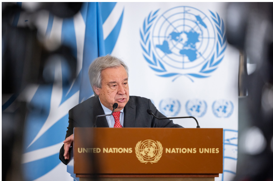
Antonio Guterres, Secrétaire général des Nations Unies, lors d'une conférence de presse, 55ème session du Conseil des droits de l'homme, Palais des Nations, Genève, Suisse.

À titre d'exemple, au Canada, une BYD Seagull EV (une automobile chinoise) se vendrait aux alentours de 15960 $ seulement, alors que le prix d'une Chevrolet Bolt EV se situe entre 40797 $ et 41542 $.