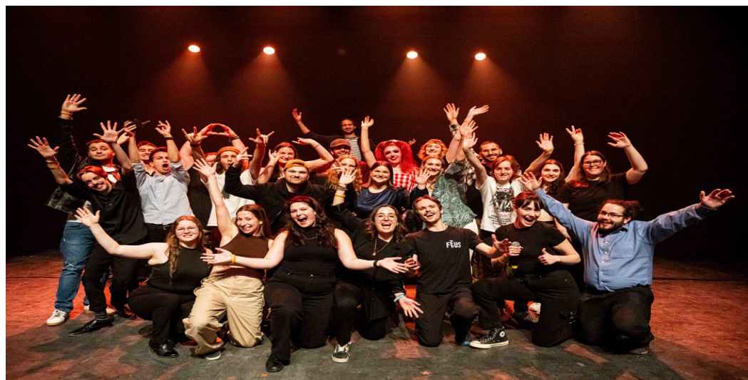
Le comité organisateur et les artistes sur scène lors d'UdeS en spectacle le 24 janvier 2024. (Voltaic)

C'est à l'aide d'auditions que le comité choisit les gens qui se produiront devant public au Théâtre Granada.