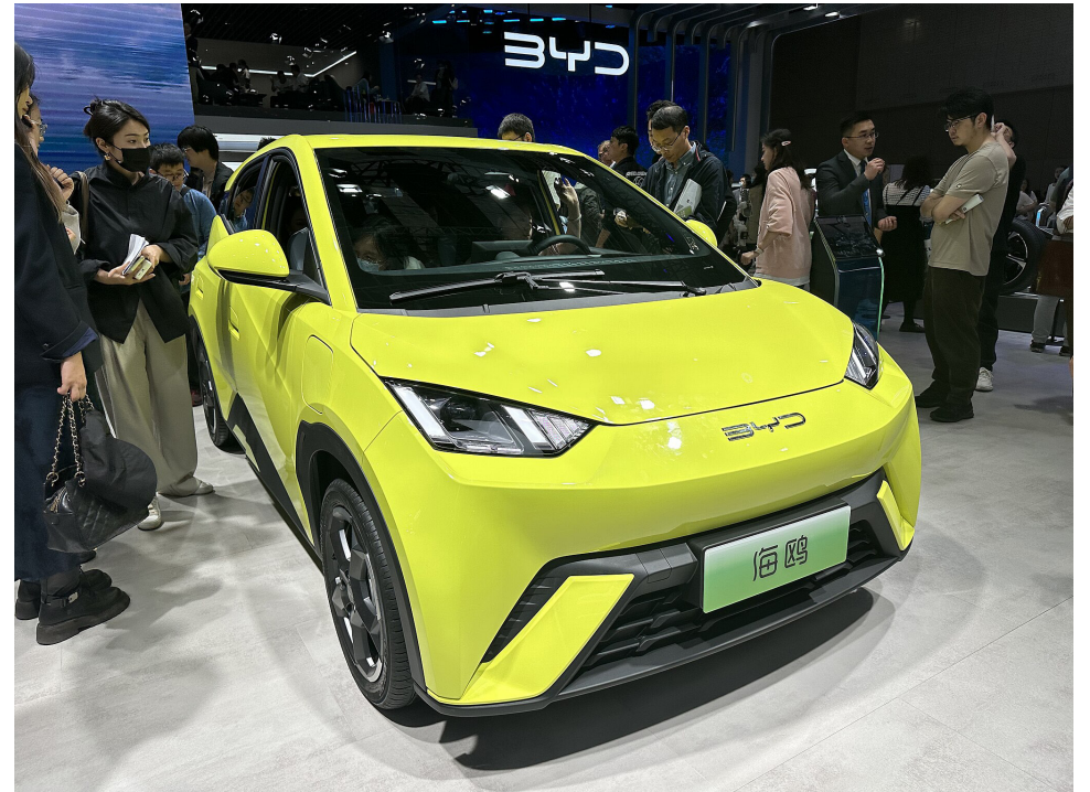
Automobile Seagull de BYD lors d'une exposition de la compagnie.

L'annonce a été faite par le Premier ministre Trudeau lors d'une conférence de presse à Halifax, le 26 août dernier. «La Chine ne respecte pas les mêmes règles que les autres pays», a déclaré ce dernier. De son côté, la ministre de la promotion des exportations, du Commerce international et du Développement économique, Mary Ng a expliqué ce changement par la «concurrence déloyale» de la Chine.