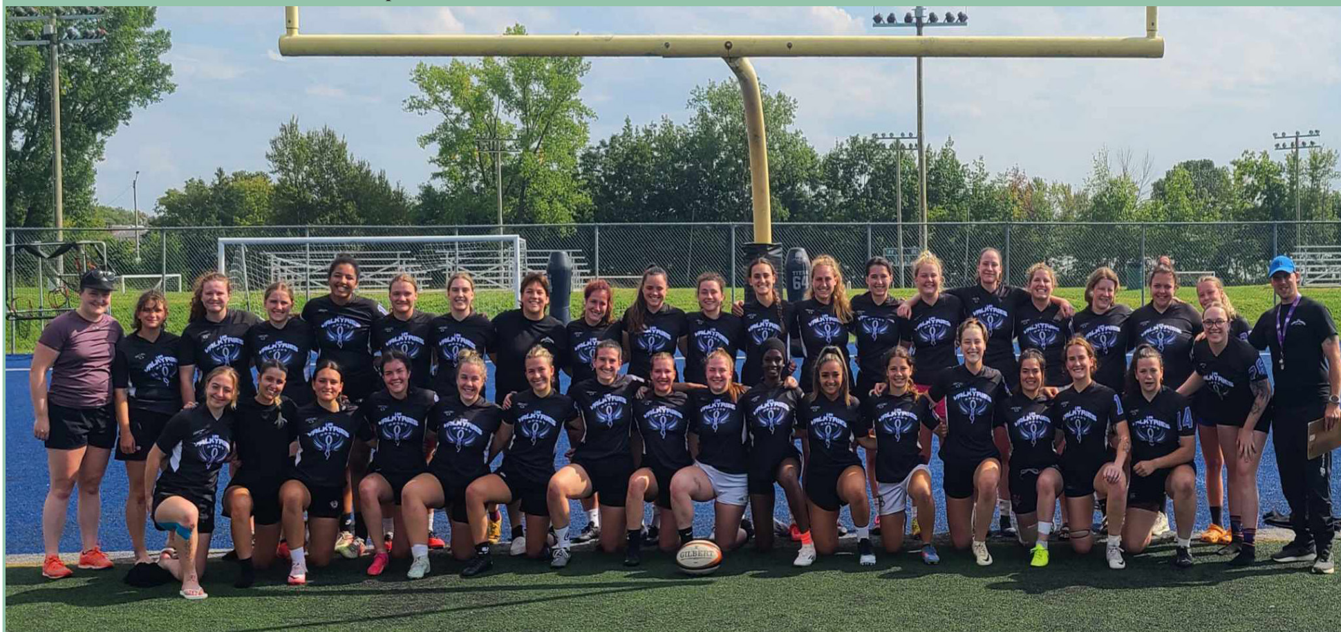
Les Valkyries ont tenu leur camp d'entraînement le 24 et 25 août dernier. (Valkyries)