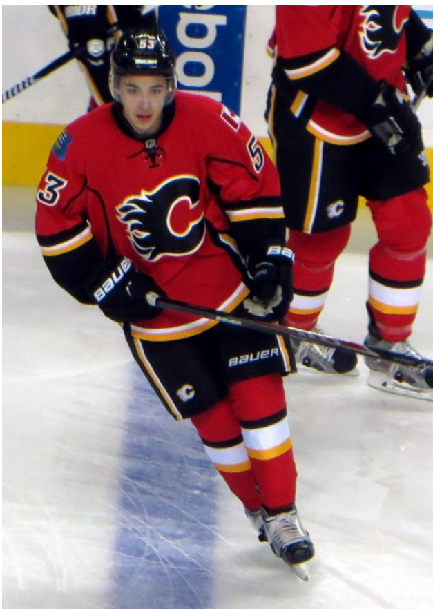
Johnny Gaudreau, alors qu'il évoluait avec les Flames de Calgary. (Resolute)

Les deux frères profitaient de la soirée du 29 août pour faire une balade à vélo dans le New Jersey lorsqu'ils ont été frappés mortellement par le conducteur d'une voiture qui a tenté un dépassement par la droite. Le conducteur n'aurait pas vu les frères sur leur vélo, et les aurait happés de plein fouet en tentant sa manœuvre, leur infligeant des blessures fatales. L'individu a été arrêté et fait face à des accusations de mort par automobile, de conduite imprudente et de possession d'un récipient ouvert et de consommation d'alcool dans un véhicule à moteur. Selon l'Associated Press, le conducteur Sean M. Higgins aurait admis aux policiers qu'il avait consommé cinq ou six bières avant de monter dans sa voiture et qu'il aurait continué à boire en conduisant.