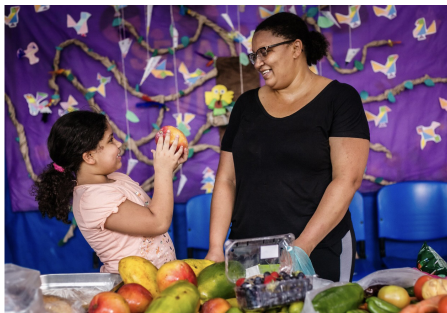
Une femme et sa fille de la nourriture provenant de The Global FoodBanking Network. (GNF)