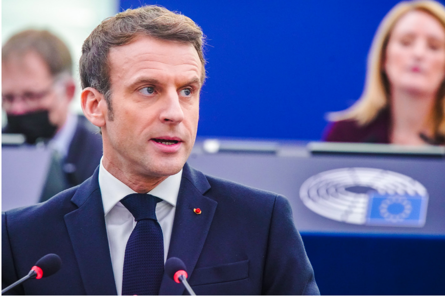
Le président français Emmanuel Macron à l'hémicycle de Strasbourg..

En effet, cela fait plus de 50 jours que le gouvernement de Gabriel Attal, le premier ministre issu de la formation politique du président Macron, a démissionné. La raison en est simple : la coalition du camp présidentiel a perdu la majorité relative qu'elle détenait à l'Assemblée nationale.