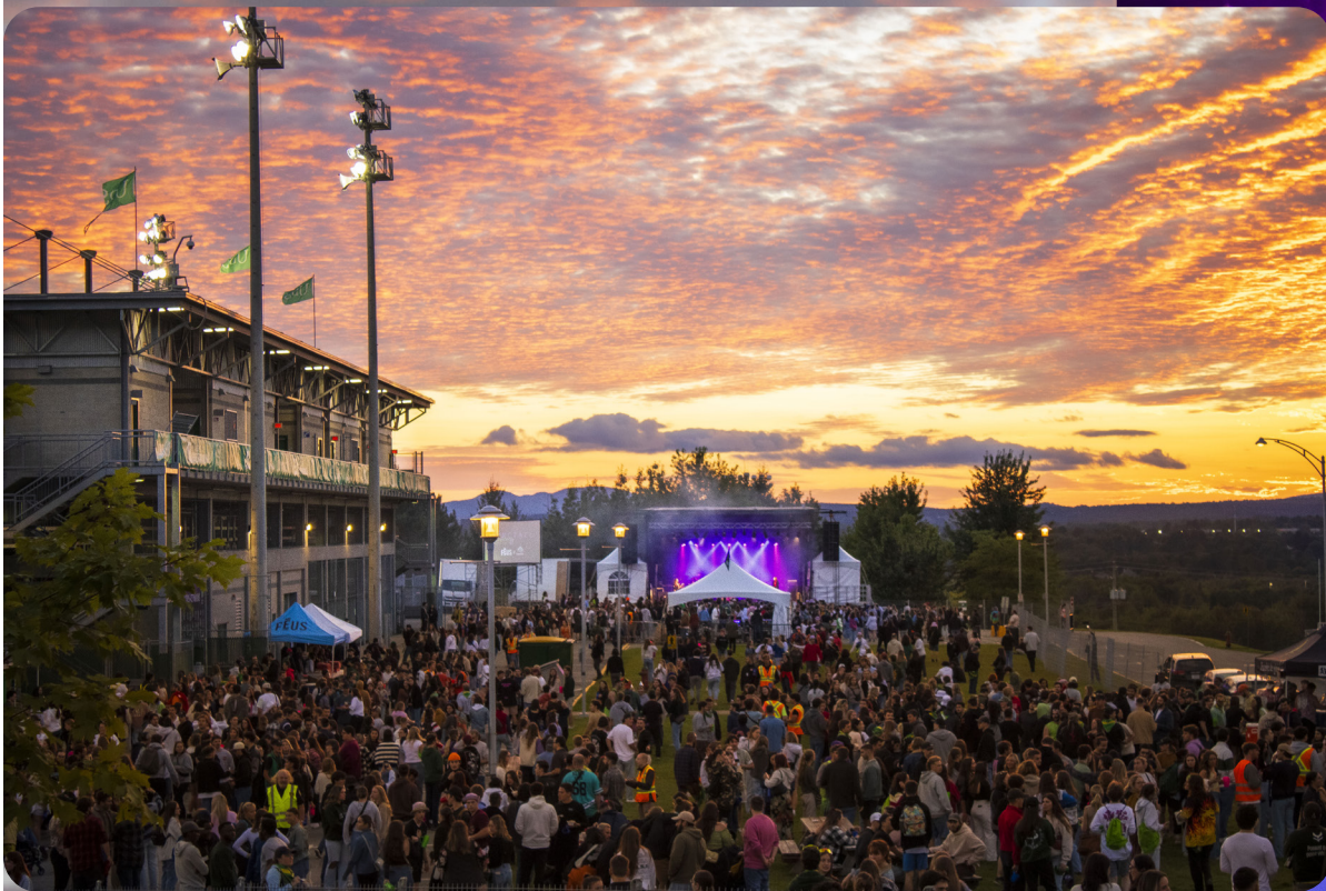
Le Spectacle de la rentrée vue d'une colline.