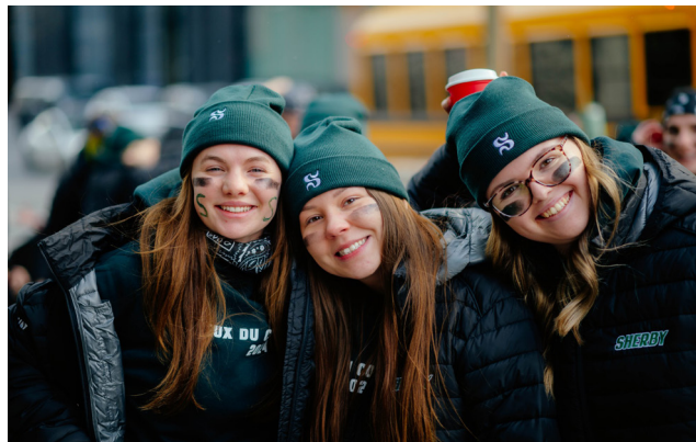
Les Jeux du commerce font partie des compétitions de l'École de gestion. (Comité de compétitions)

En tout, ce sont quatre grandes compétitions qui sont organisées : le symposium GRH axé sur les ressources humaines, les Jeux du commerce (JDC) qui regroupent tout ce qui est administration et économie, l'Omnium financier pour la finance, la fiscalité et la comptabilité, et le Happening marketing qui est davantage basé sur le marketing. En plus, quelques autres petites compétitions ont lieu entre les autres événements.