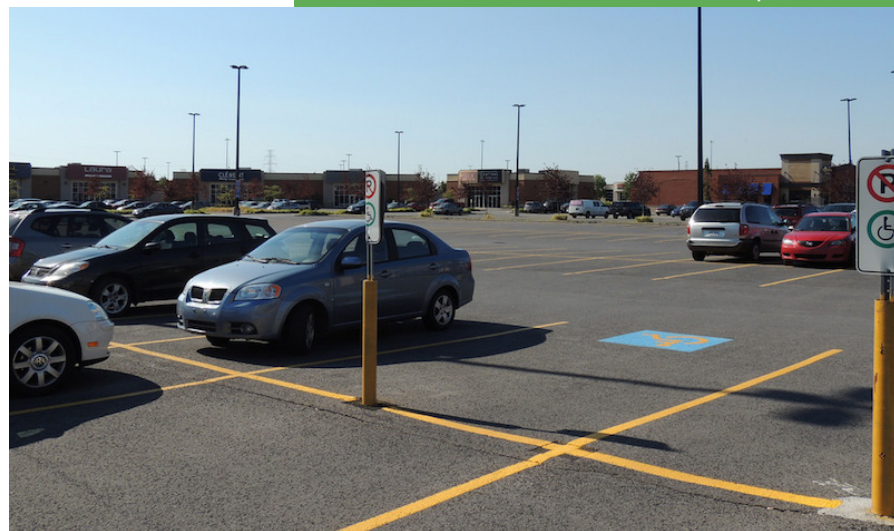
Des municipalités du Québec et de l'Ontario imposent de plus en plus une taxe sur l'asphalte pour contrer les îlots de chaleur, réduire le ruissellement des eaux et financer les infrastructures (Vivre en Ville).

Aux États-Unis, l'Agence de protection de l'environnement (EPA) mentionne que le tiers des aliments ne sont pas consommés, et qu'en 2019, 96 % des produits gaspillés ont fini dans les décharges, les installations de combustion ou encore dans les égouts.