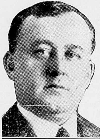
L'hon. Fernand Rinfret, maire de Montréal, président d'honneur du dernier débat.