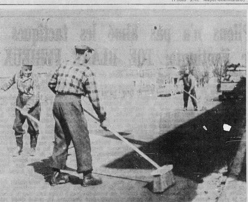
NETTOYAGE DU PRINTEMPS — A l'instar de tant de villes à ce temps-ci de l'année, Sturgeon Falls s'est lancée à l'assaut et poursuit assidûment sur ses rues le grand nettoyage du printemps. Cette photo a été prise à quelques portes seulement des bureaux du "Droit". Sans doute impressionné par tant de labeur, notre photographe, ne voulant évidemment pas se faire damer le pion, s'est permis de croquer sur le vif cet exemple de propreté qui est le mot d'ordre de tous les citoyens.