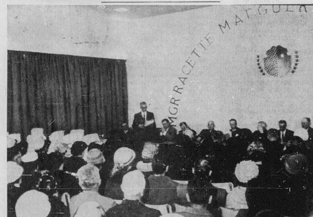
VUE GENERALE — Prés de deux cents personnes ont assisté à la bénédiction des écoles Mgr O. Racette et Marguerite d'Youville, à Verner, dimanche dernier, et ont entendu d'intéressantes allocutions prononcées par les dignitaires dans l'auditorium. La photo nous fait voir une partie de la foule pendant l'une des allocutions.