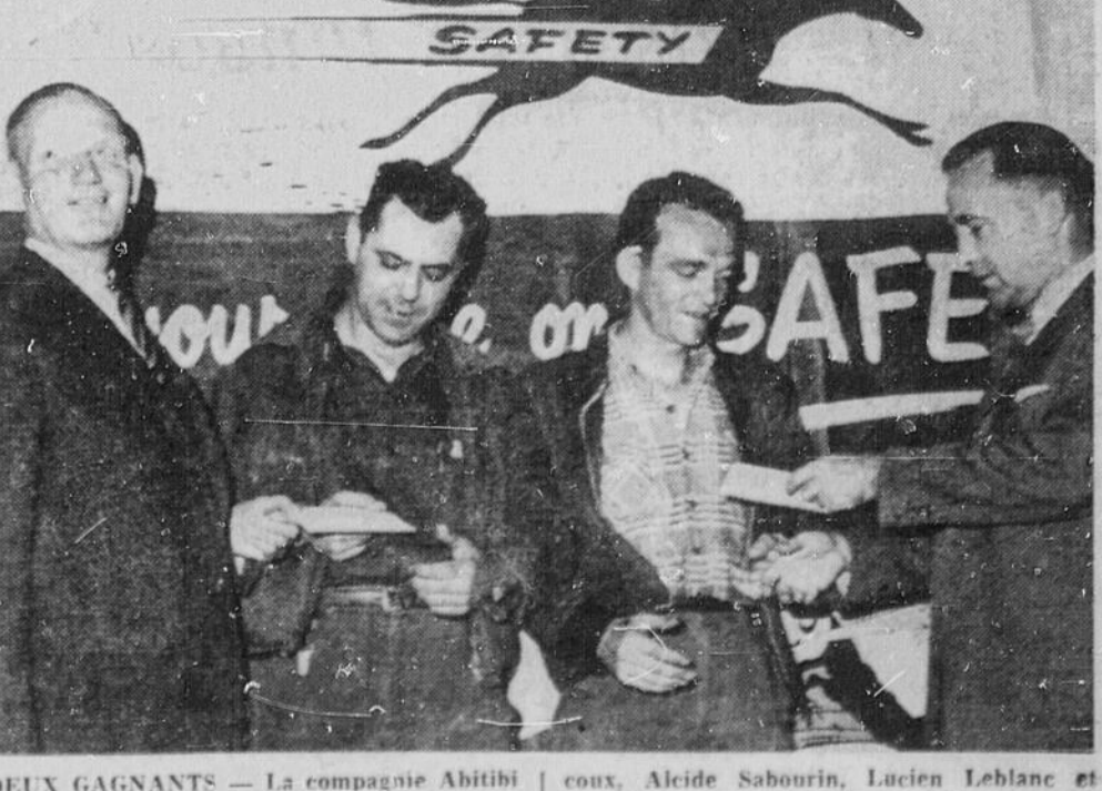
DEUX GAGNANTS — La compagnie Abitibi Paper and Power, à son moulin de Sturgeon Falls, vient de compléter une deuxième période de cent jours sans accident et sans perte de temps au travail. On a distribué quatre prix de $25 aux gagnants, MM. Lorenzo Mar-

Mandés sur les lieux, les ambulanciers de l'Exclusive ont transporté les blessés à l'hôpital général et à l'hôpital St-Louis-Marie-de-Montfort. Le corps de la victime a été transporté à l'hôpital St-Louis-Marie-de-Montfort où le coroner E.J.S. Major, d'Orléans, a constaté la mort. Une autopsie devait être pratiquée au cours de l'après-midi pour déterminer la cause exacte de la mort.