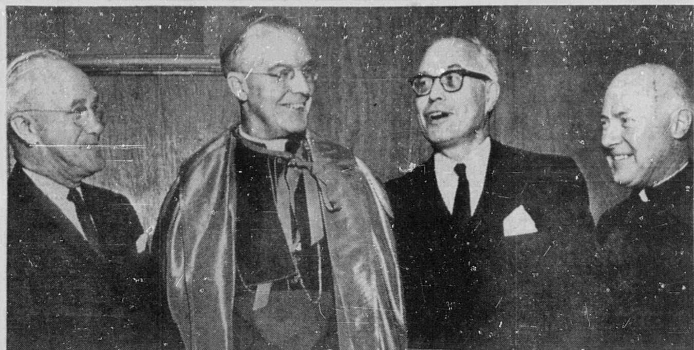
BANQUET ANNUEL — Quelque 300 personnes ont assisté, dimanche soir, au deuxième banquet annuel de l'Université de Sudbury, à la salle de la Légion canadienne. Mgr. Alexander Cartier, évêque du diocèse du Sault-Sainte-Marie et chancelier de l'Université, a prononcé un important discours sur

Par son scintillement rappelant l'éclat d'un rayon de soleil, le diamant a même inspiré certaines peuplades primitives à une nouvelle croyance qui attestait l'existence d'une flamme inextinguible, et d'une vertu à toute épreuve.