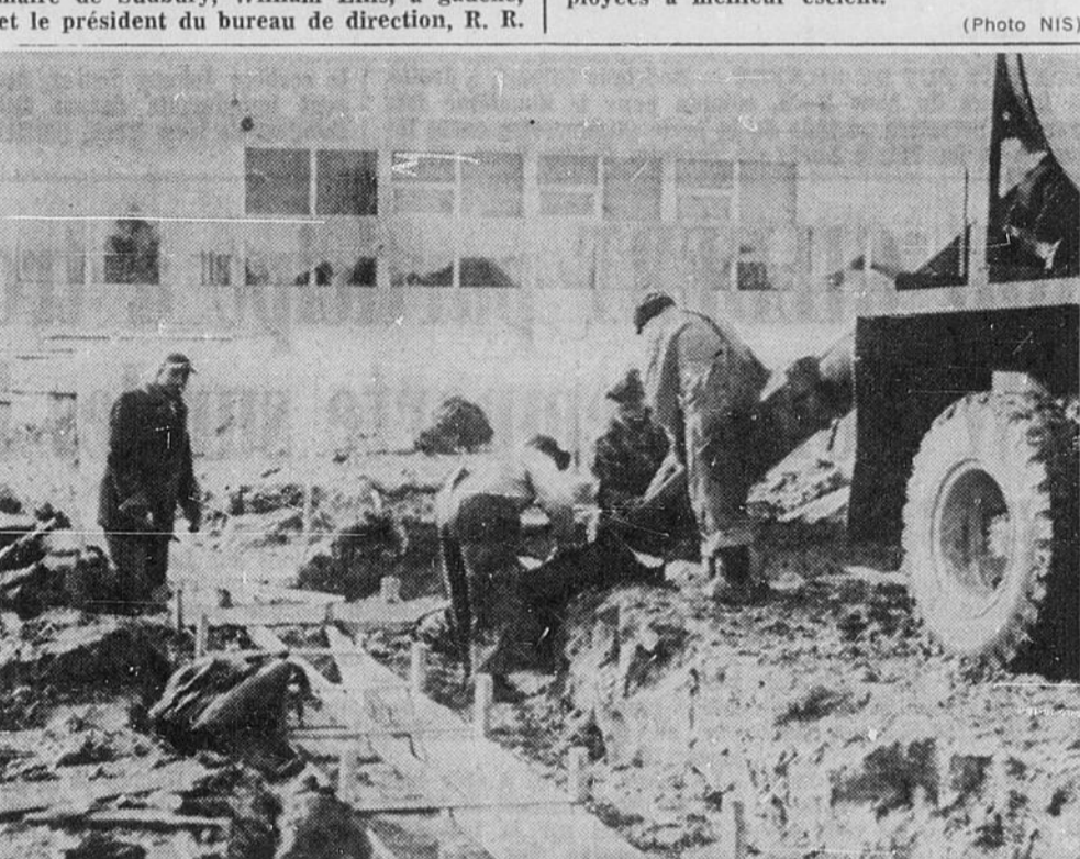
LES TRAVAUX DE COULAGE — L'annexe de plus d'un million de dollars que l'on est à construire à l'École secondaire de la vallée de Chelmsford, sera bientôt terminée. La photo nous fait voir un groupe d'ouvriers en train de couler le ciment pour la fondation d'un mur d'intérieur. Cette nouvelle section ajoutera quatre classes au cours académique, en plus des 13 classes déjà existantes et dont nous voyons quelques fenêtres à l'arrière-plan. On y comptera également un caféteria et un gymnase. Certaines classes serviront à l'enseignement commercial et à la préparation élémentaire à divers métiers.