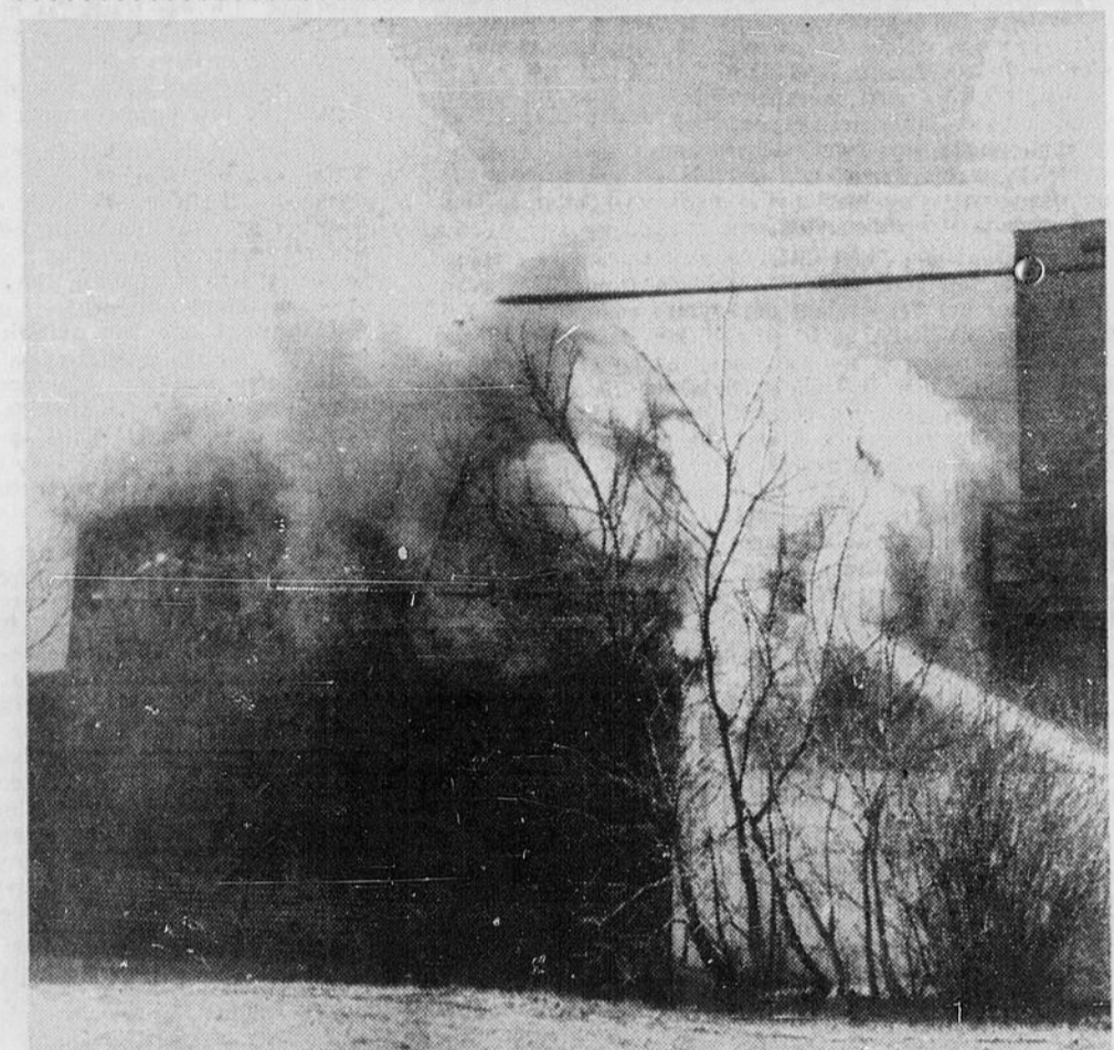
INCENDIE A STURGEON FALLS — Un incendie qui s'est produit mardi matin, à Sturgeon Falls, a entièrement détruit une remise où des meubles étaient emmagasinés. Le feu s'est déclaré dans la remise de chez Russell, magasin de variétés qui était loué par la maison Parker-Sauvé, marchands de meubles. Cette remise est située sur la rue King. Le contenu était entièrement assuré de même que la bâtisse elle-même. Les membres de la brigade des incendies de Sturgeon se sont rendus sur les lieux et ont réussi à maîtriser les flammes. Cependant les dégâts ont été considérables et on a réussi à empêcher les flammes de se propager aux bâtisses avoisinantes.