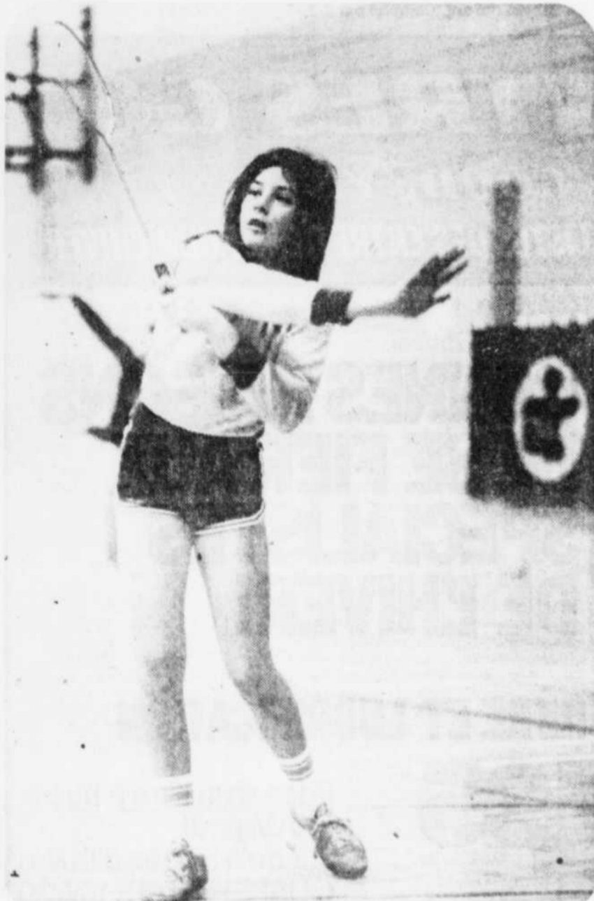
Le Soleil, René St-Pierre

A cause du manque de neige, la compétition de ski alpin qui devait se tenir au Mont Hibou, a dû être annulée et remise à plus tard.