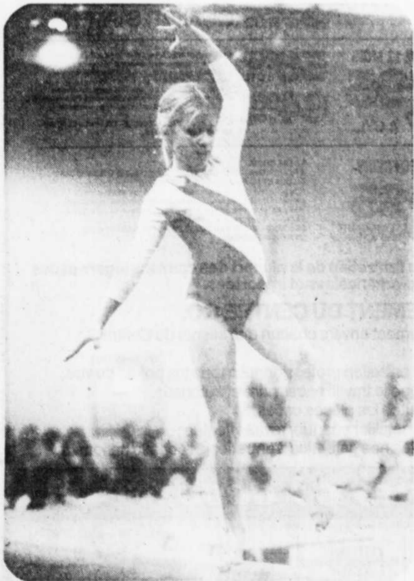
On tente de garder l'équilibre sur la poutre...