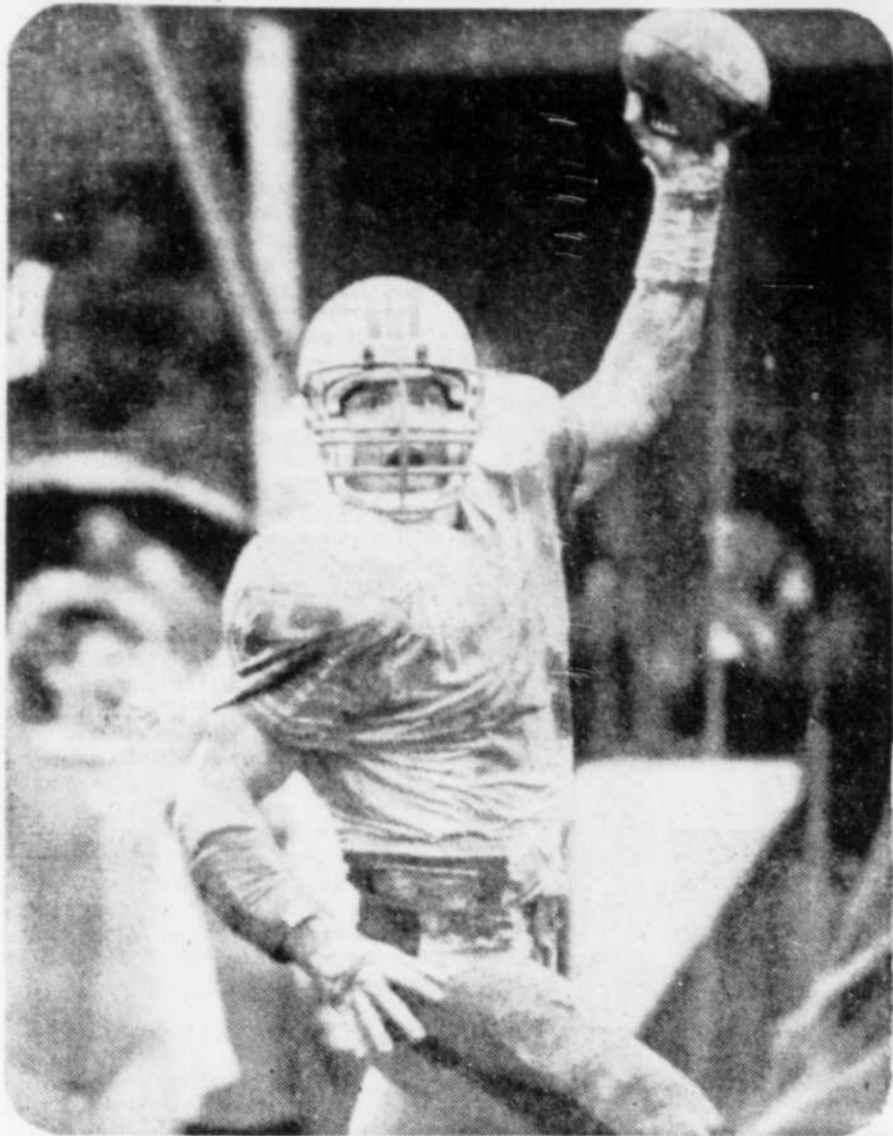
Le secondaire A.J. Duhe, des Dolphins de Miami, vient d'intercepter une passe pour filer dans la zone des buts.