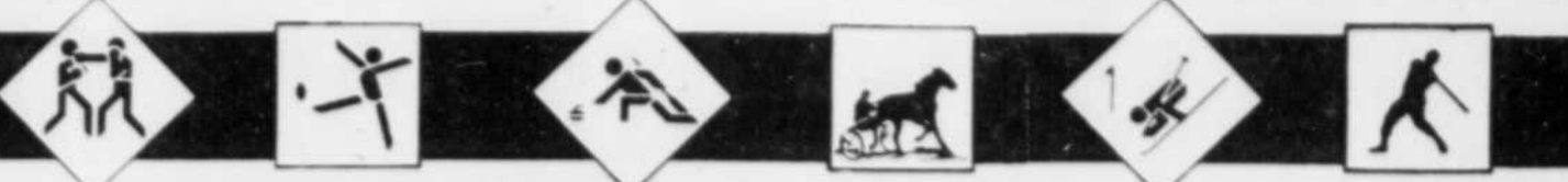
Tableau des résultats