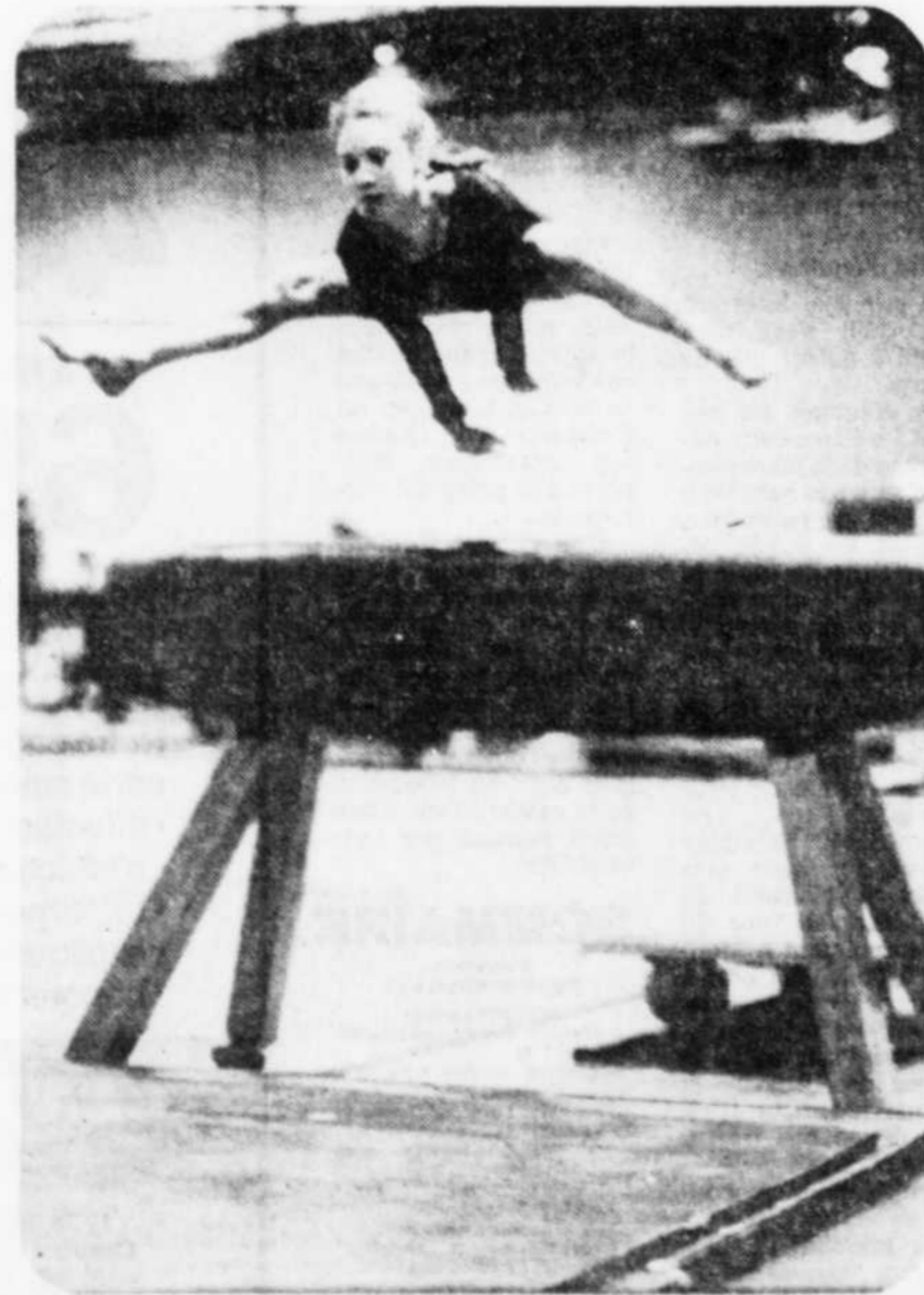
pendant qu'une autre franchit avec aisance le cheval sautoir...