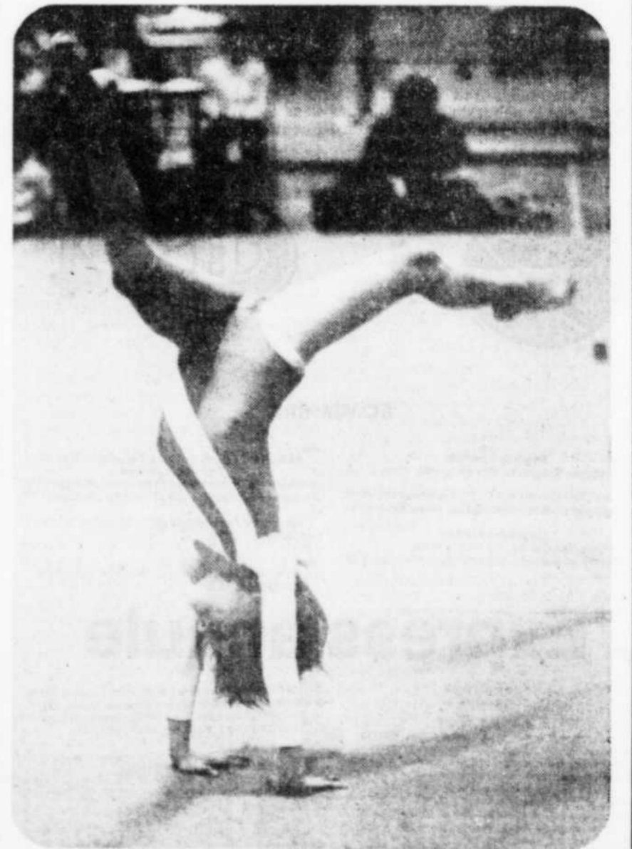
et qu'une troisième réussit un exercice au sol.

Même à deux, ces joueurs de l'école Apprenti-Sage ne peuvent enlever le ballon à un adversaire beaucoup plus grand.