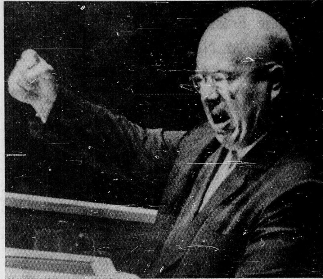
KHROUCHCHEV a soumis aux Nations unies un projet de désarmement en trois étapes.

Khrouchchev a aussi fait distribuer une déclaration sur les nouveaux pays indépendants de même qu'une proposition en trois points: 1. Accorder l'indépendance immédiate à tous les territoires dépendants. 2. Éliminer toutes les fortresses du colonialisme, dont les possessions et les régions à bail