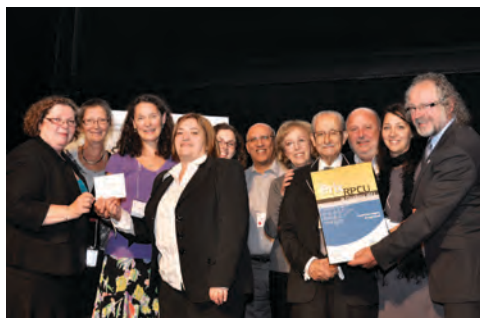
Catégorie Promotion – Droits Le comité des usagers de Vigi Santé (Lanaudière).