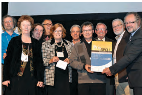
Catégorie Accompagnement Le comité des usagers du CSSS Alphonse-Desjardins (Chaudière-Appalaches).