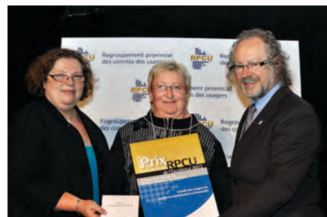
Catégorie Information (Budget de moins de 25 000 $) Le comité des usagers du Centre régional de réadaptation La RessourSe (Outaouais).