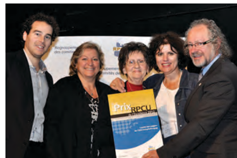
Catégorie Promotion – Services Le comité des usagers du CSSS de Memphrémagog (Estrie).