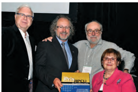
Comité de l'année Le comité des usagers du Centre universitaire de santé McGill, CUSM (Montréal).