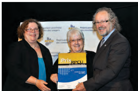
Catégorie Information Mention spéciale du jury (Budget de moins de 25 000 $) Le comité des usagers du CSSS des Collines (Outaouais).