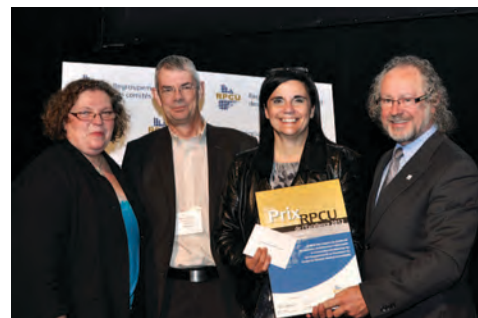
Catégorie Accompagnement Mention spéciale du jury Le comité des usagers CRDITED de la Mauricie et du Centre-du-Québec – Institut universitaire (Mauricie).