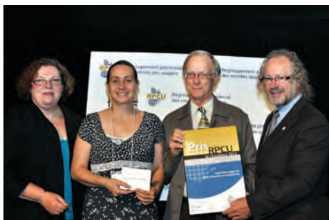
Catégorie Information (Budget de plus de 25 000 $) Le comité des usagers du CSSS d'Ahuhtsic et Montréal-Nord (Montréal).