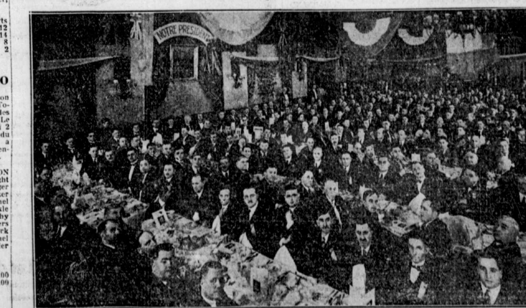
BANQUET de la Première Convention des MAGASINS INDEPENDANTS VICTORIA, organisée par Laporte Martin Limitée, le 23 janvier 1929, Hôtel Queens, Montréal, P.Q.

Dans la rencontre précédente, les juniors ont défit ceux du Central Y. par 29-17. Les jeunes du National ont donné du très beau jeu et se sont affirmés supérieurs à leurs adversaires.